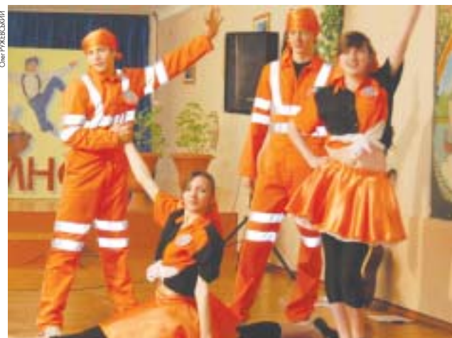
Команда з Бучацького району “Файер-фокс” посіла п'яте місце. Втім, хлопці і дівчата кажуть, що брати участь у цих змаганнях — все одно варто

— Ми беремо участь у фестивалі уже третій рік поспіль, — розповідає вчитель фізкультури команди