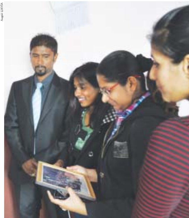
Діти з Бережанської школи-інтернату виготовили для іноземців сувеніри — аплікації та квіти з паперу