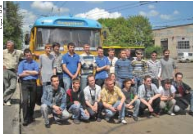
У "Тернопільських покатушках" взяли участь гості із Рівного, Івано-Франківська, Луцька та Києва

Двогодинне катання в салоні троллейбуса по "вбитих" міських дорогах нагадувало круті американські гірки. Особливо на вулиці Промисловій, де прокладена найновіша в місті лінія. Антон Бри-