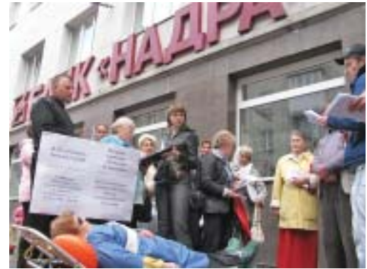
ШТУРМУВАЛИ “НАДРА БАНК”