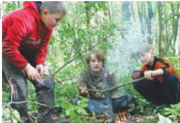
Пластуни розпалювали вогонь і кип'ятили воду у казанку — це було одне із завдань на змаганнях

Після "Свята весні" у пластунів розпочинаються літні мандрівки з ночівлею у наметах і без них.