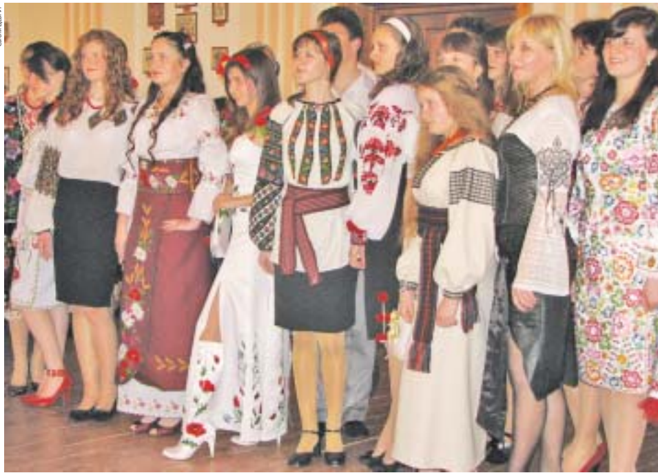
Участь у конкурсі вишитого костюма взяли 55 випускників різних шкіл міста. Двадцятьеро учасників отримають грошові нагороди — по 500 грн кожен