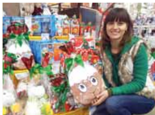
ЧИМ ПРИКРАСИТИ ЯЛИНКУ?