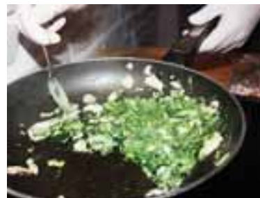
Гриби нарізати, тушувати, додати шпинат, спеції, влити вершки, варити