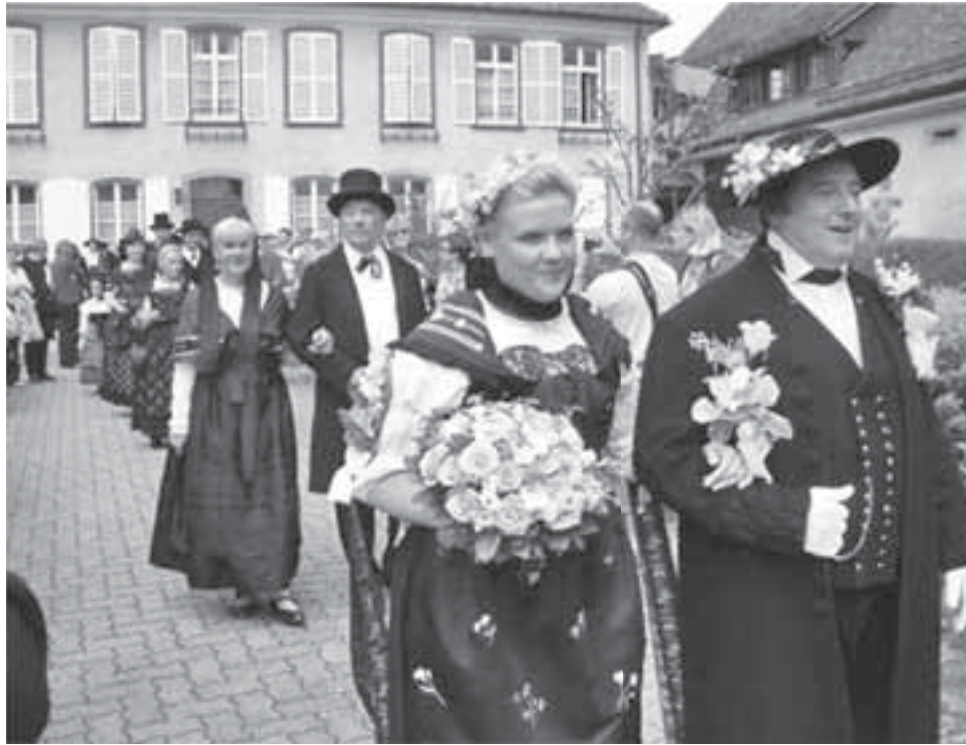
У Страсбурзі вдягають на весілля національні костюми. Така традиція існує і в інших регіонах Франції

Традиції ■ Німці — більш прагматичні, економні та консервативні у плані весілля. Громадяни Китаю дарують на весілля тільки гроші у червоних конвертиках, святкування в них менш тривалі, ніж в українців. Французи взагалі не зв'язують себе сімейними узами у надто молодому віці