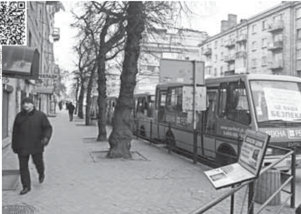
У Тернополі страйкували резервні маршрутки. Перевізники вимагають підняти плату за проїзд до трьох гривень

У місяці 22 робочих дні (в середньому), тобто це 88 поїздок. У суботу люди їдуть на базар чи в інших