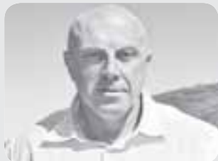
Ігор Побер — народний депутат