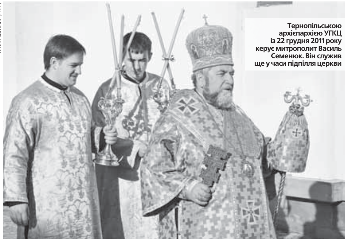
Тернопільською архієпархією УГКЦ із 22 грудня 2011 року керує митрополит Василь Семенюк. Він служив ще у часи підпілля церкви

— Найбільшими є молитовні рухи і громади загальноцерковного характеру. Так, «Матері у молитві» є мало не у кожній парафії. Поширене «Братство Матері Божої Неустанної Помочі». Серед молодіжних організацій, то приблизно на 40% парафій є «Марійські дружини». Діє товариство українських студентів-католиків «Обнова».