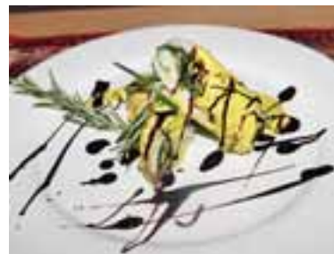
Готовий рулет розрізати, полити соусом, прикрасити кремем-глясе і розмарином

Шеф-кухар Сергій Головайчук (26 р.): — Вага рулета 125 грамів, вартість — 33 гривні