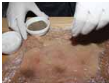
Куряче філе не дуже сильно відбити, щоб не порвалося, посолити, поперчити