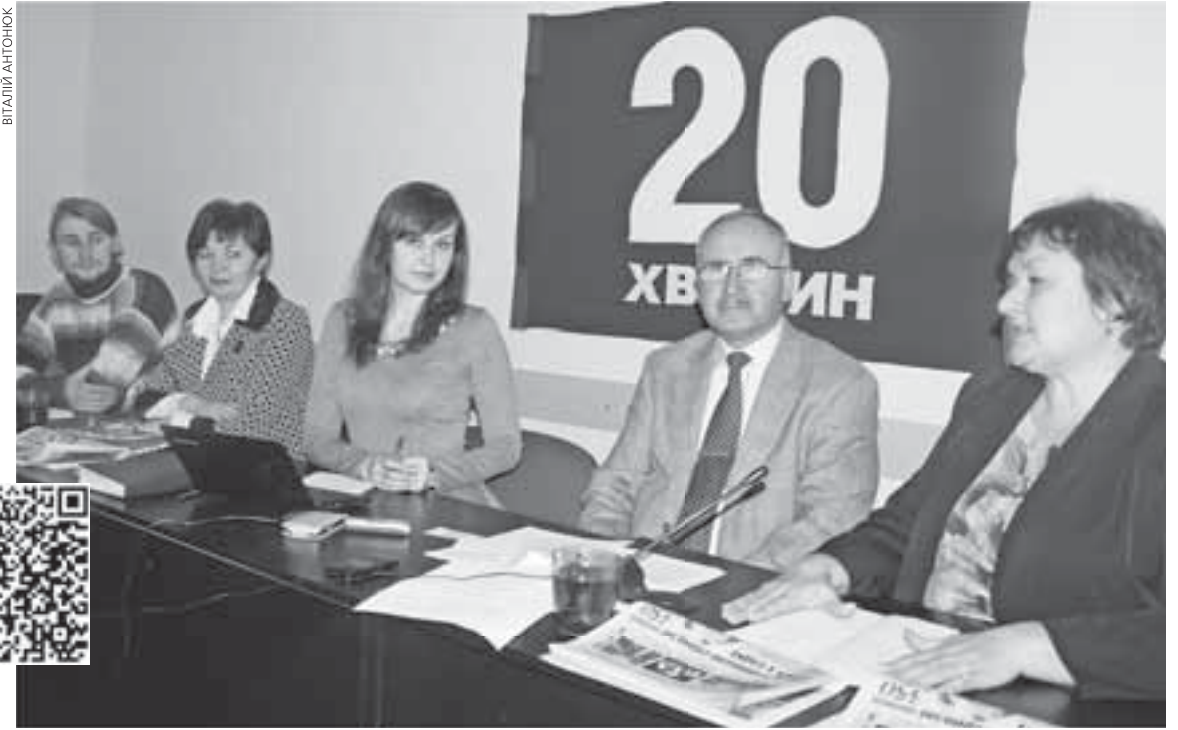
Усі чемні дітки цього року отримають подарунки від святого Миколая, говорили гості програми. Для соціально незахищених категорій будуть окремі сюрпризи

— В одному із супермаркетів міста стоїть ялинка, прикрашена листівками із бажаннями діточок. Кожен охочий може долучитися до благодійної акції та купити подаруночок для конкретного малюка, — пояснює вона. — Акція зорієнтована, перш за все, на дітей з особливими потребами, які не можуть