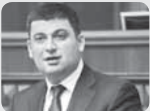
Володимир Гройсман — голова Верховної Ради України

На прохання читачів ми відновили рубрику «Відомі люди очима дітей». Задля експерименту наш кореспондент показала дітям фото політиків, високопосадовців і просто відомих тернополян. І запитала: «Хто ці люди?»