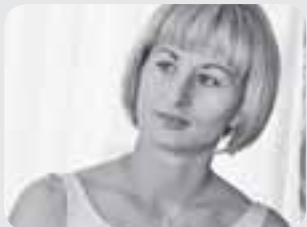
Валентина Семеренко — біатлоністка