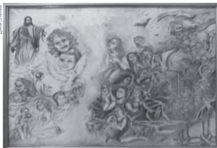
Картина „Життя в раю чи пеклі”, виконана кольоровими олівцями, посіла п'яте місце серед робіт засуджених жінок

Отець Михайло багато років є капеланом Бережанської виправ-