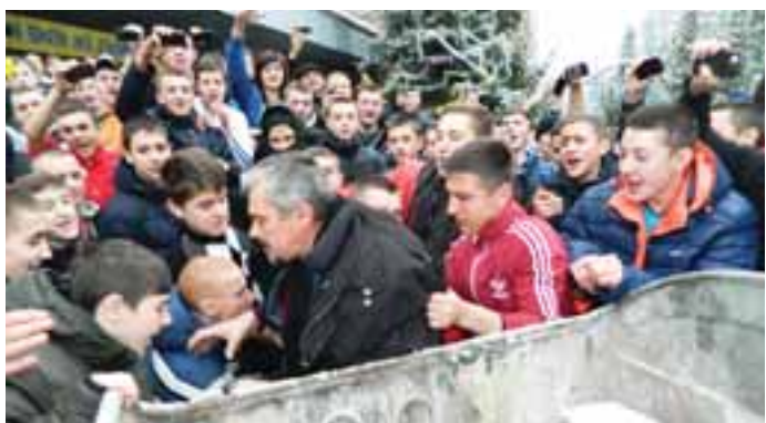
ФЕДИКА «ЛЮСТРУВАЛИ» У СМІТНИКУ