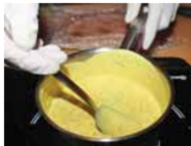
Влити вино, довести до кипіння, варити 3-5 хвилин, додати фундук, куркуму, спеції