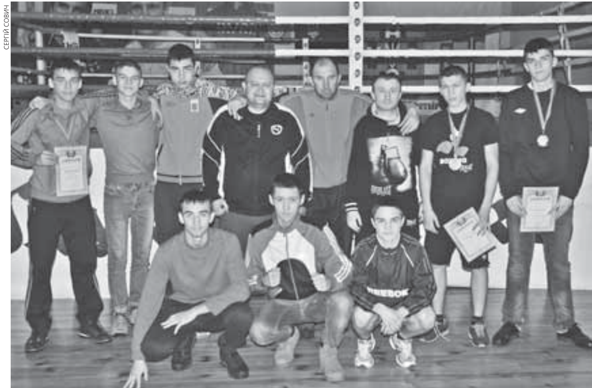
Четверо з десяти членів збірної Тернопілля у Львові завоювали нагороди

Одну срібну і три бронзові медалі завоювали юні боксери з Тернопілля на чемпіонаті України. За словами тренера, очікування від виступу були більшими, але декому завадили суддівські помилки. Після важкого сезону на боксерів чекають канікули