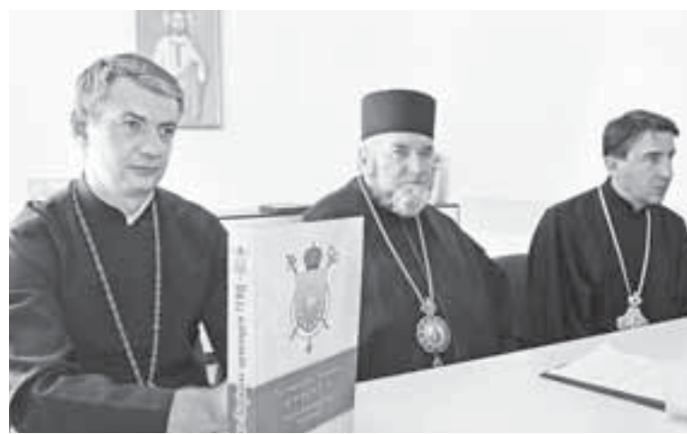
Детальну інформацію про історію, храми і парафії УГКЦ Тернопільсько-Зборівської митрополії видали окремою книгою