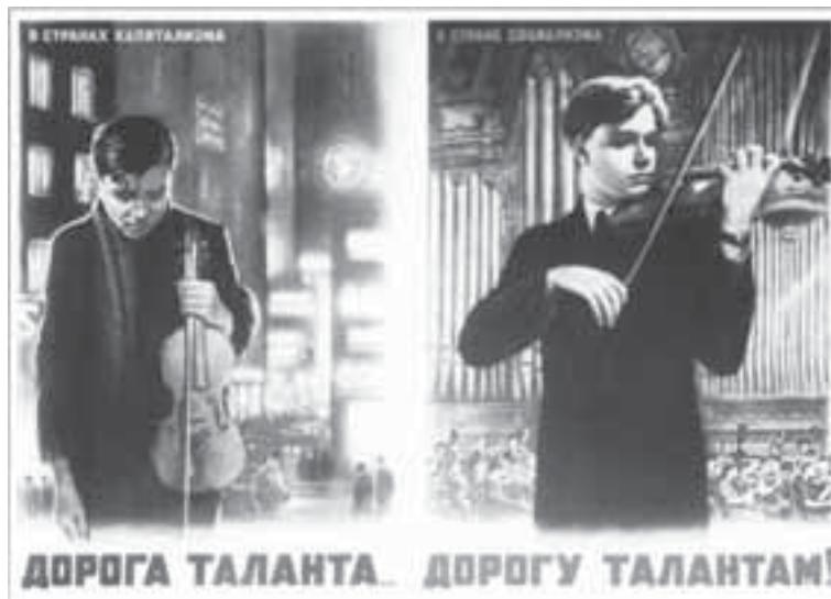
Талановитій молоді, як стверджували, краще в СРСР, а не США

«Уоллес попередив, що Сполучені Штати не можуть панувати над народами Європи. «Ми можемо, — сказав далі Уоллес, купити французів на рік чи два. Французи вигнали комуністів з