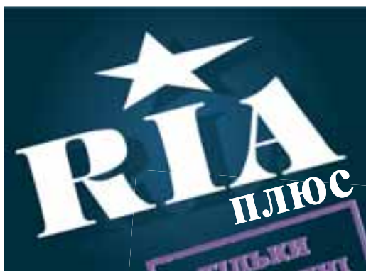
СЕРЕДА 17 грудня 2014