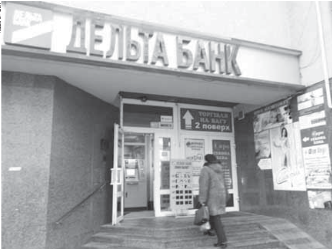
Банкомати «Дельта банку» у Тернополі не працюють. Люди скаржаться, що не можуть зняти кошти. У фінустанові коментувати ситуацію відмовилися

НАТАЛІЯ БУРЛАКУ, 0-97-445-82-67, NATALIYA.BURLAKU@20MINUT.UA