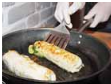
На філе викласти начинку — шпинат з грибами, згорнути, як голубець, обсмажити