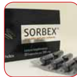
Сорбенти (якщо ацетон з'явився після підвищення температури і, як наслідок, інтоксикації)