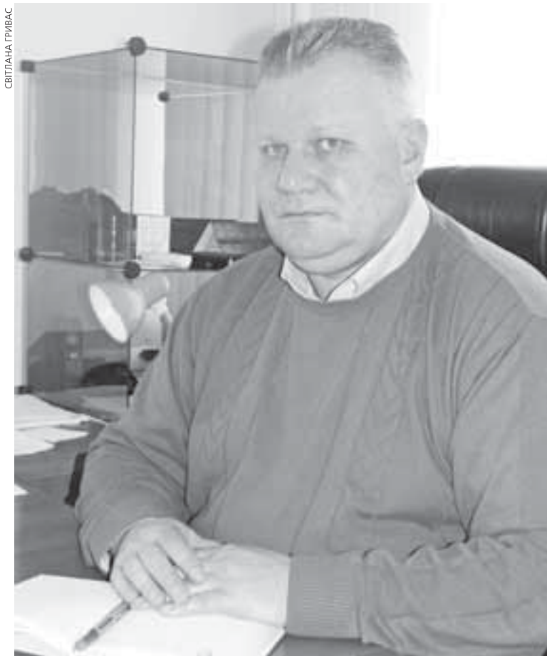
Результати досліджень продуктів — молока і м'яса показали, що відхилень від норм немає, — повідомив 27 січня головний державний санітарний лікар Євген Безрукий

— Перші результати попередніх лабораторних досліджень з вірусологічної лабораторії