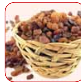
Відвар із родзинок