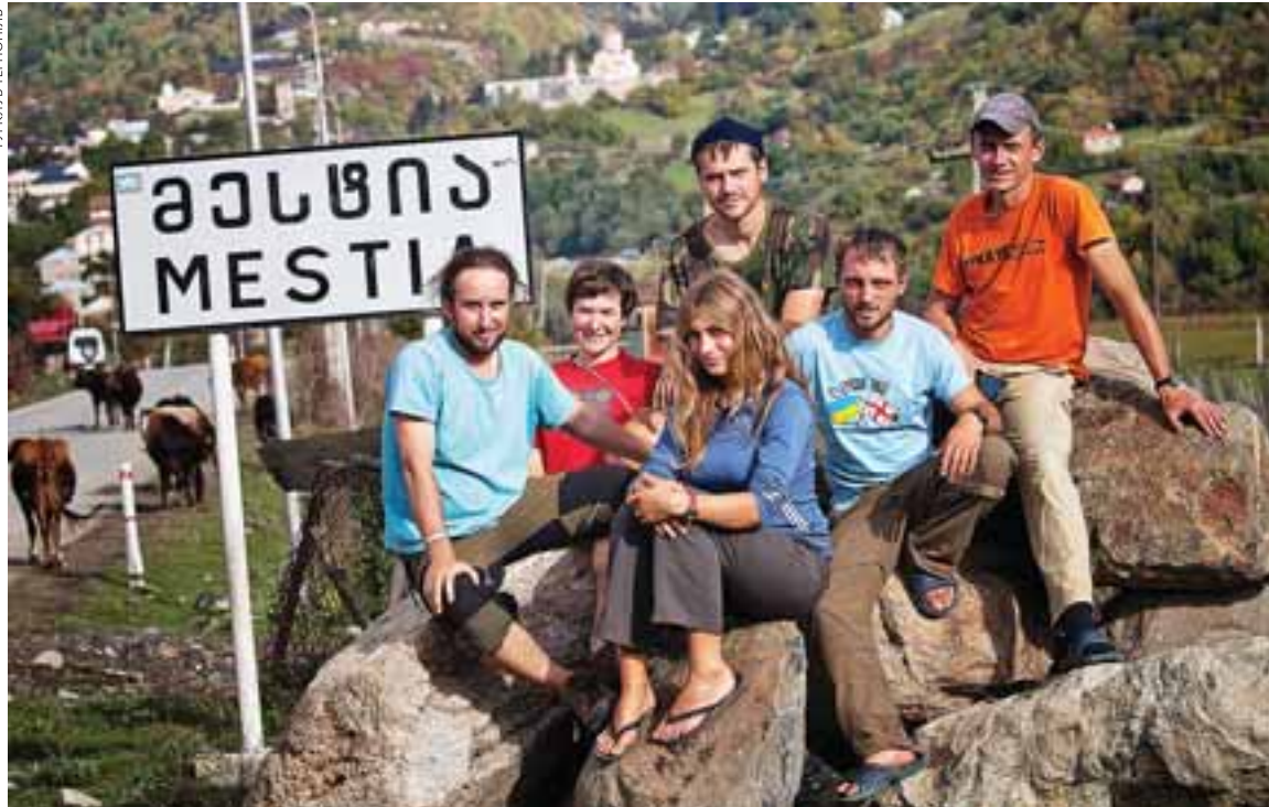
— «Турклуб Тернопіль» раніше пропонував тури в Грузію, що передбачали сходження на Казбек, рафтинг і трекінг. У 2014 р. через фінансові труднощі попит на цей напрямок знизився

Певно, найбільше простих громадян хвилюють перспективи гривні, а також коливання інших валют. Тут однозначності немає. У бюджет заклали курс 17 грн/USD. Morgan Stanley ще 15 грудня проголосив, що, відповідно до їхніх розрахунків, курс гривні буде лише 16 гривень за долар, демонструючи таким чином стриманий оптимізм. Тож аналітики на всеукраїнському та міжнародному рівнях певні, що стрімка девальвація гривні — на 50% — залишиться у 2014 році, а в 2015 українська валюта якщо і падатиме, то помірними темпами.