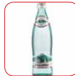
Мінеральна вода «Боржомі» (спершу випустити газ)