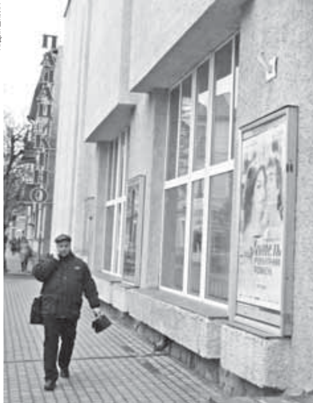
«Палац Кіно» не вперше втрачає свою площу. Приміром, у 2014 році списали 109 кв. м

АНДРІЙ ШКУЛА, 0-97-724-35-45, ANDRIY.SHKULA@20MINUT.UA