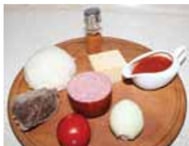
Замісити дріжджове тісто, підготувати решту необхідних продуктів

50 г вареної телятини, 40 г цибулі, 80 г твердого сиру, 30 г саямі, 2 г гострої меленої паприки, 30 г помідора, 220 г тіста, сушений базилік.