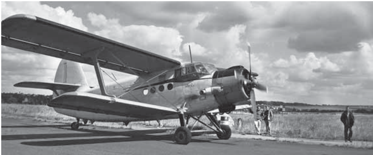
Ось такі літаки АН курсували з тернопільського аеродрому щодня у 1980-х. На відпочинок до моря і навіть додому, до батьків, через Борщів, Мельницю-Подільську та Кременець жителі Тернопільщини літали цілими сім'ями, пригадують старожили

Аеропорт ■ Лише годину займала мандрівка на море в Одесу для тернополян, коли працював місцевий аеропорт. Квиток коштував 17 рублів. У Крим можна було гайнути за неповних три години і 22 рублі, пригадують старожили, які користувалися нашими повітряними воротами