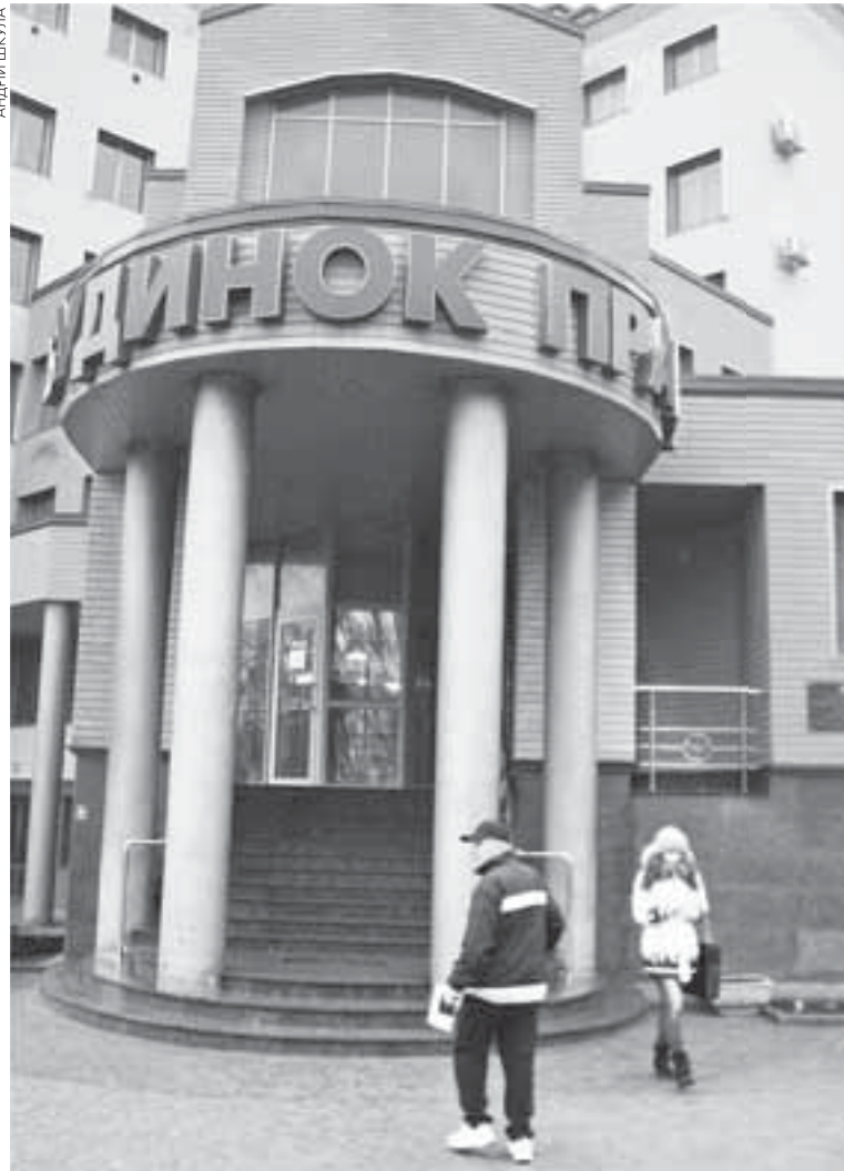
Тернополян, з якими ми спілкувались, нарікають, що мали проблеми через брак інформації від центру зайнятості