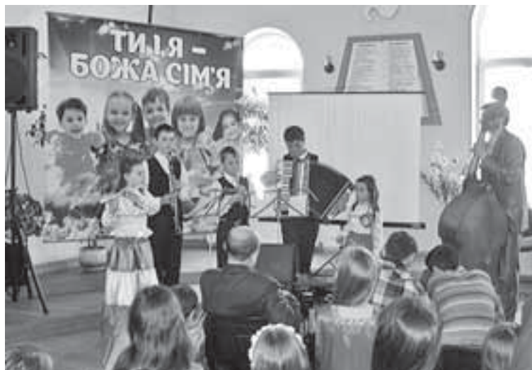
Конфесія проводить Тернопільський обласний музичний фестиваль «Ти і я — Божа сім'я»