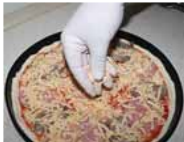
Натерти на «буряковій» тертці твердий сир, притрусити ним паляницю