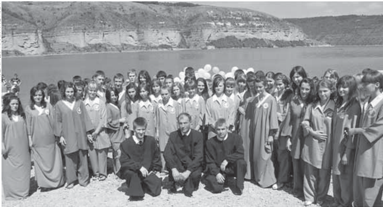
Члени Церкви адвентистів сьомого дня Тернопільської області на святі хрещення у молодіжному таборі «Юність»