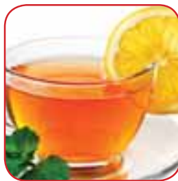
Солодкий теплий чай