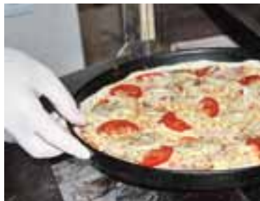
Викласти на піцу скибки помідора і кільця цибулі, запікати 4-5 хв. при 300°C