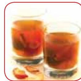
Компот із сухофруктів