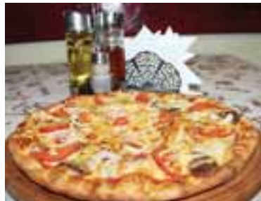
Готову піцу посипати сухим базиліком, розрізати на однакові частини