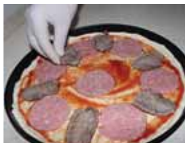
Змастити томатним соусом паляницю, викласти скибки саямі і вареної телятини