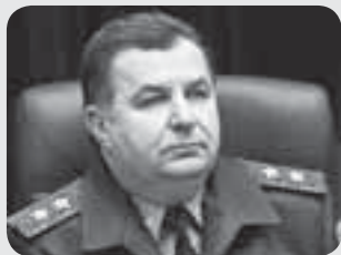
Геннадій ВОРОБИЙОВ — перший заступник начальника Генерального штабу Збройних Сил України

— Він вмів в'язати різні шарфи і шкарпетки, як моя бабуся. А потім дарує їх дітям, щоб їм взимку було тепло.