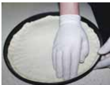
Змастити форму олією, розкочати з дріжджового тіста паляницю