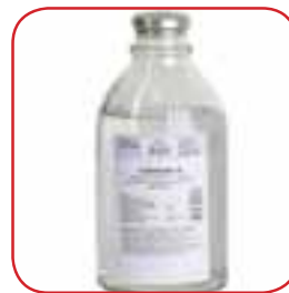
Глюкоза (в таблетках, ампулах, флаконах — 10% або 40%)

При ацетоні не можна заливати дитину рідиною при спробах напоїти! Напій має бути поділений на порції і часте — по чайній ложці теплої рідини кожних 3-5 хвилин. Якщо змусити дитину випити багато і відразу, вона може вирвати.