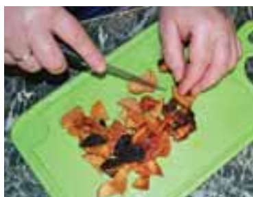
Відцідити із сухофруктів воду, накраяти все вузькою соломкою