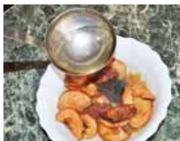
Промити і запарити в окропі сухофрукти, залишити їх на 20-30 хвилин

У тому, що ця каша дуже смачна, я переконалася вже за мить. З'їла її всю до крихти, і ще кортіло. Тож цю смакоту усім раджу.