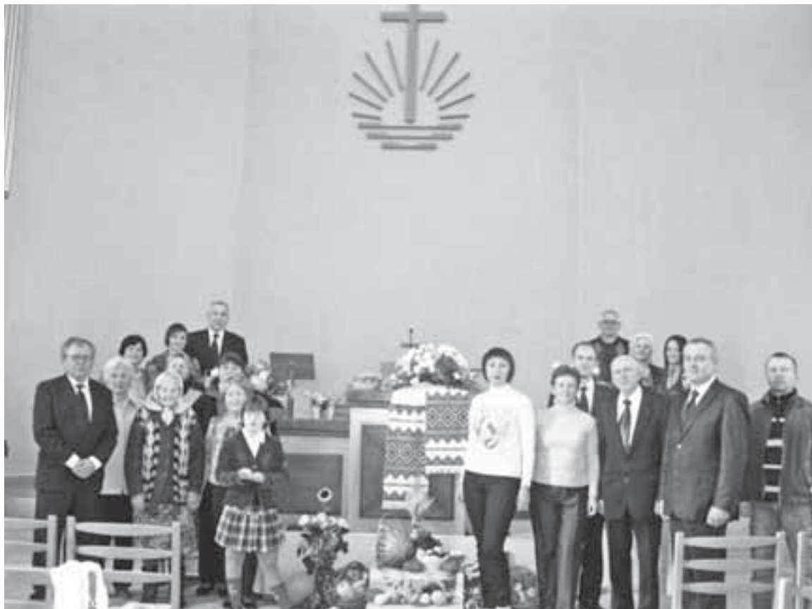
Богослужіння з нагоди вдячності за врожай у Новоапостольській церкві у Тернополі

редковано чи прямо згадується про 21 апостола. Коли мене запитують, якою є наша Церква, я коротко відповідаю — євангельською й апостольською.