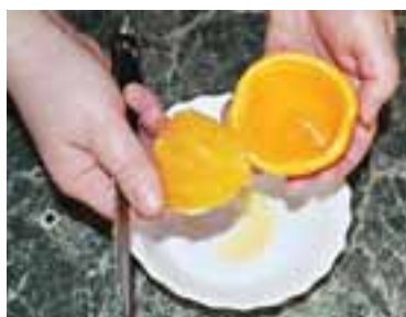
Зрізати в апельсині "кришечку", вибрати ложкою всю м'якоть