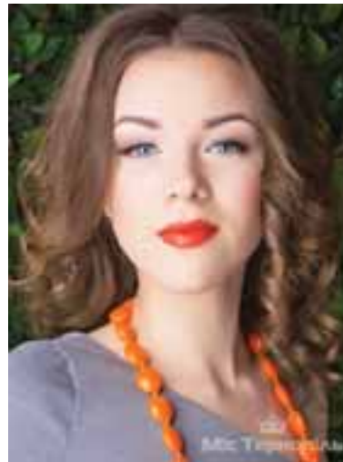
Папа Любов, зріст 170 см, параметри 86-61-90