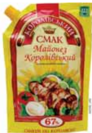
Невеликий ананас (або банка консервованих ананасів)