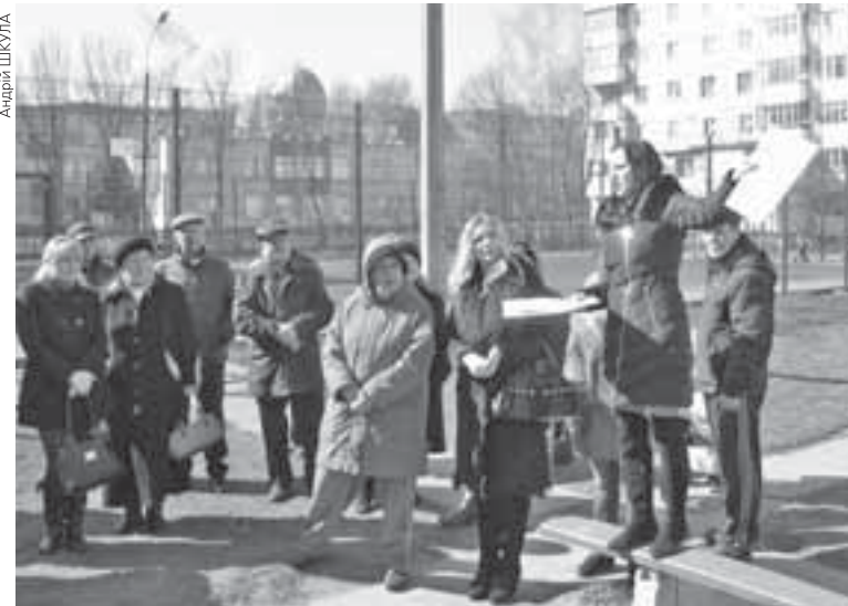
Мешканці будинків №№ 27 та 29 на вул. 15 Квітня проти того, аби землю під їхніми вікнами віддали під ринок. Щоб ніхто не зробив шкоди, люди навіть чергувати на ділянках готові