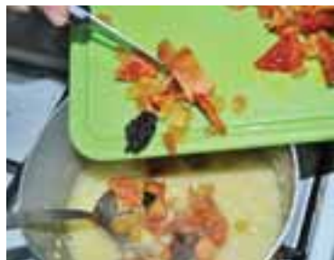
Висипати в окріп пшоняну крупу, варити 20 хвилин, додати сухофрукти