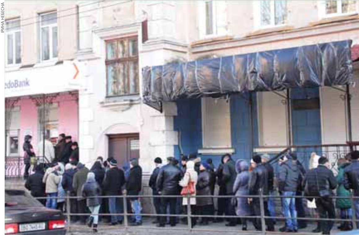
Із початку року в області різко зросла кількість охочих виїхати на роботу за кордон. Люди годинами стоять у черзі до банку, щоб оплатити послуги візового центру

До заробітчанин-утікачів здебільшого ставляться негативно. Мовляв, покидають країну у скрутний час. Однак заробітчанинство має й позитивні наслідки.