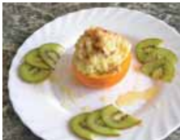
Прикрасити страву скибками ківі, полити пшоняну кашу рідким медом