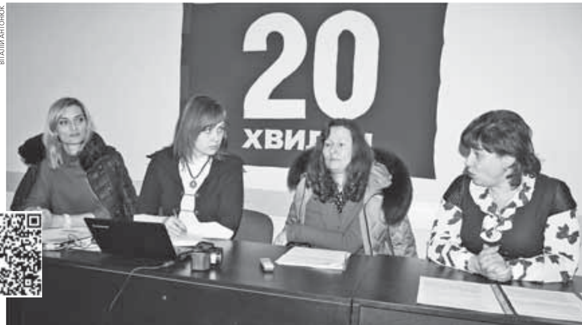
Під час чату поговорили про збільшення вартості харчування в дитсадках, а також про зміни у меню та вимоги щодо організації харчування дітей

На питання, чим годували дітей у той час, коли міська санепідемслужба на два тижні забо-