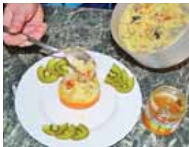
Начинити гарячою кашею із сухофруктами половинку апельсина