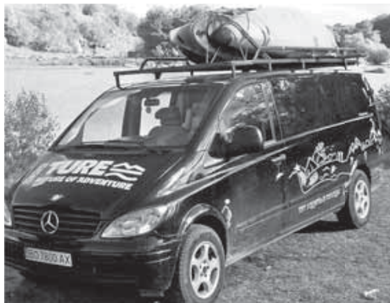
Результатом наїзду у яму стали погнутий диск і зламаний задній правий важіль. Потрібно було викликати евакуатор

За словами водія, львівські даїшники пояснили, що мусять скласти протокол і тільки після