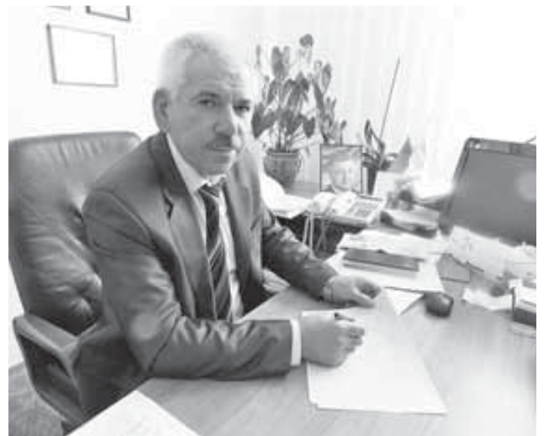
Директор «Укрпошти» Василь Юрчишин (54 р.), на якого скаржаться працівники, каже, що готовий до компромісу

Пан Юрчишин наголошує, що щомісяця на «Укрпошті» проводять День якості. Мета — поспілкуватися з працівниками відділень, дізнатися про проблеми.