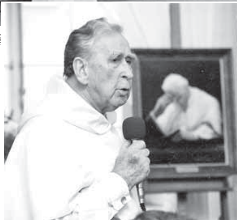
Окрім наукової роботи, отець Кромпець часто виступав на радіо і перед великими аудиторіями

Доля ■ Один із найбільших католицьких гуманістів сучасності Мечислав Альберт Кромпець народився у селі Мала Березовиця на Збаражчині і закінчив Тернопільську гімназію. Його доля – приклад працьовитості