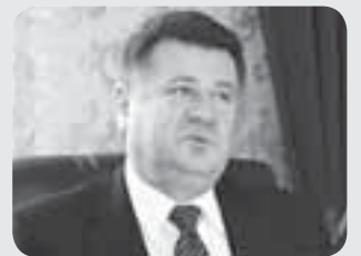
Ярослав Лемішка — директор Тернопільської філармонії

— Цю тьотю постійно показують по телевізору в різних програмах. Вона там дуже багато говорить і щось розказує людям.