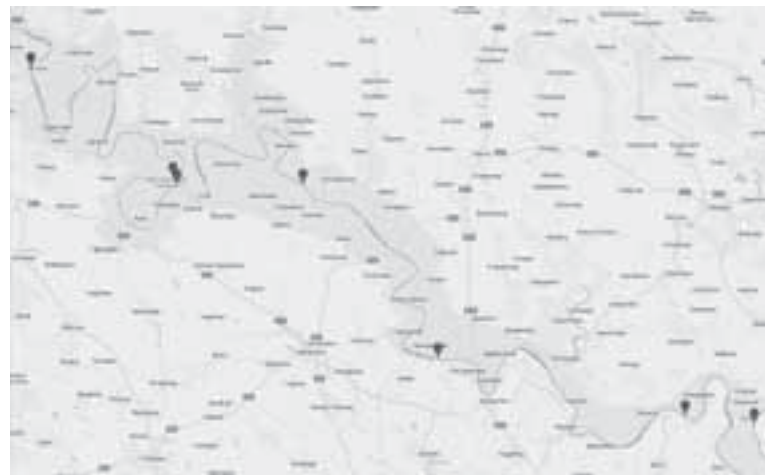
Схема розташування планованого каскаду ГЕС на Дністрі

— Це цілковитий негатив, і рибалки категорично проти цього. Створення цих ГЕС призведе