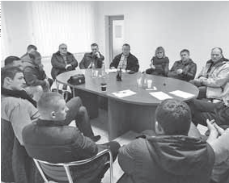
Громадська експертиза діяльності мерії, а також тих рішень, які розглядатимуть депутати, необхідна — вважають ГО та активісти