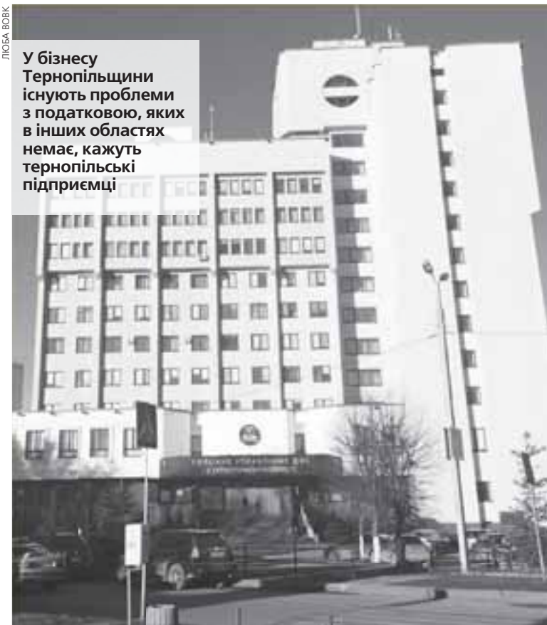
У бізнесу Тернопілля існують проблеми з податковою, яких в інших областях немає, кажуть тернопільські підприємці