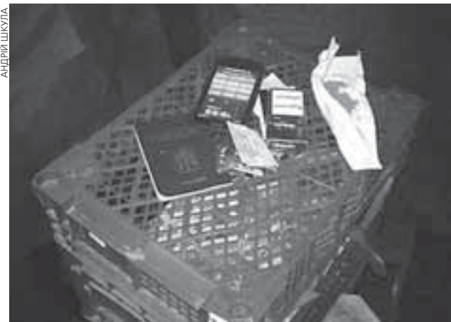
У неповнолітнього, якого затримали через підозру у крадіжці фруктів, знайшли і наркотичне зілля. Хлопець зізнався, що «трава» належить йому

Проблема! ■ У неповнолітнього тернополянина, якого солдати Нацгвардії затримали 19 грудня ввечері за підозрою у крадіжці фруктів з кіоску на зупинці на вулиці Карпенка, при огляді виявили згорток паперу з речовиною, схожою на коноплю. «Траву» віддали на експертизу