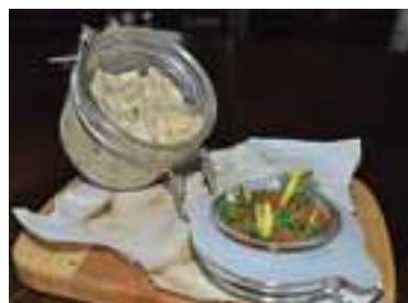
Красиво викласти грибне фуєте й обсмажені крихти хліба, відразу подавати до столу