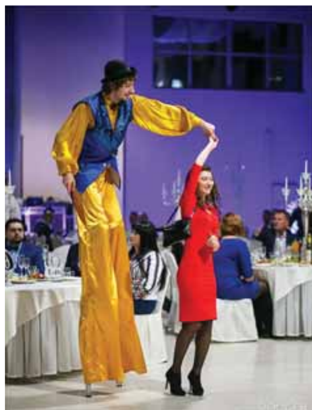
До початку свята гостей розважали міми, жонглер та ходулісти з Львівської циркової студії