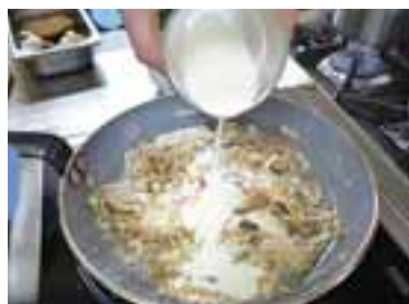
Влити вершки, додати сіль, перець, зменшити вогонь, трохи випарувати вершки