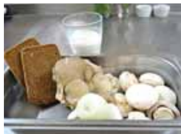
Помити і печериці і гливи, нарізати хліб, почистити цибулю, влити густі вершки

Роблю так, як сказав Віталій, й аж завмираю від задоволення. «Грибне фуєте» хочеться з'їсти до останньої крихти.