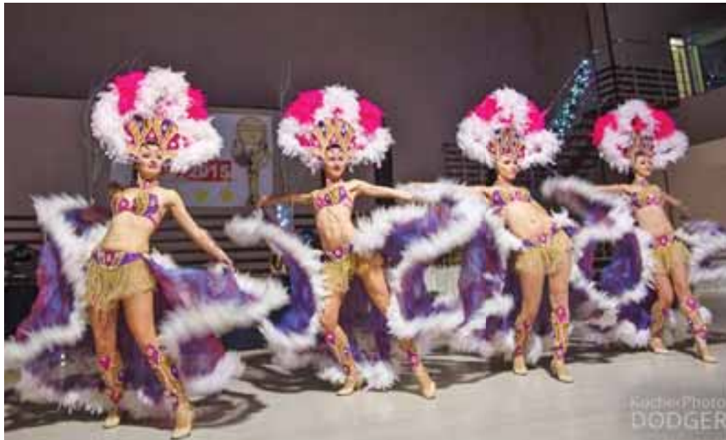
Відкривали свято танцівниці з шоу-балету «Візаві»