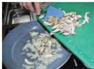
Обсмажити цибулю, гливи — до золотистого кольору, додати печериці