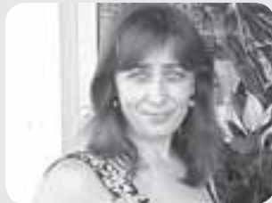
Наталія Шоломейчук — підприємець, депутат округу №40