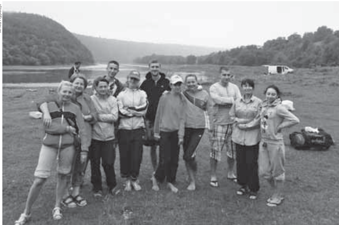
Якщо ГЕС на Дністрі збудують, такі долини, де відпочивають туристи, просто затопить