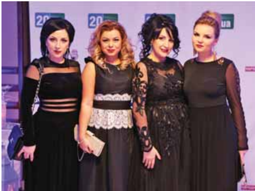
Переможниці із клубу краси «Б'юті Клуб» — найкращий салон краси