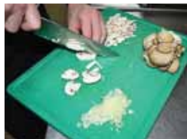
Дуже дрібною соломкою нарізати гриби, такими ж дрібними кубиками — цибулю