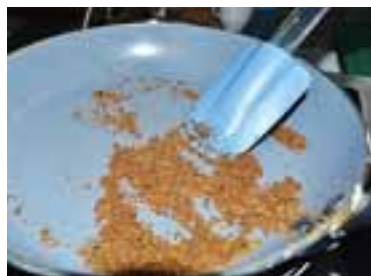
Змолоти скибки хліба, вимішати з тим'яном, сіллю, олією, підсушити на сковороді