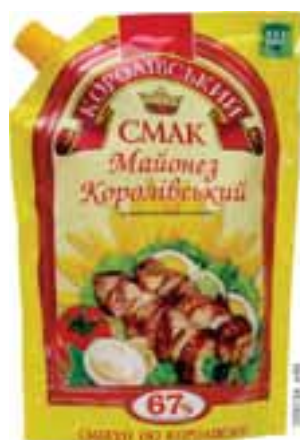
На 16 грибів потрібно: 2 солідкі перці, 2 помідори, 1