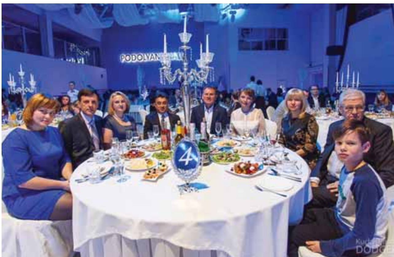
За одним столом опинились партнери свята — представники ТРЦ «Подолляни» та БК «Добрудд»