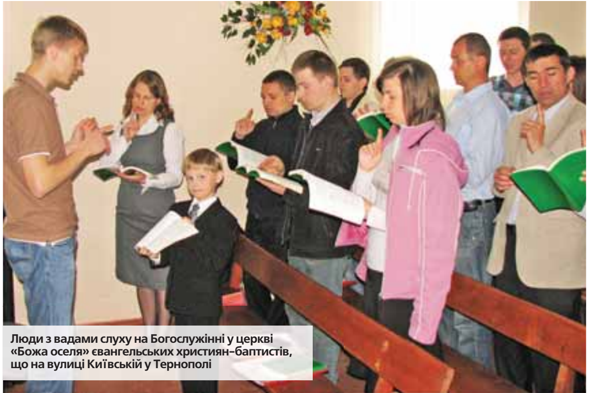
Люди з вадами слуху на Богослужінні у церкві «Божа оселя» євангельських християн-баптистів, що на вулиці Київській у Тернополі

на справжніх стосунках з Богом. Також намагаємось допомагати тим, хто має труднощі в житті. Вже багато років група молоді піклується про дітей в сиротинцях та інтернатах міста й області, регулярно відвідуючи їх. У нашій церкві віднедавна гуртуються майже два десятки людей з вадами слуху. Спільно з Благодійним фондом «Вікно життя» організували в нашому домі молитви Ресурсний центр допомоги біженцям. Усі охочі приносять необхідні речі, і