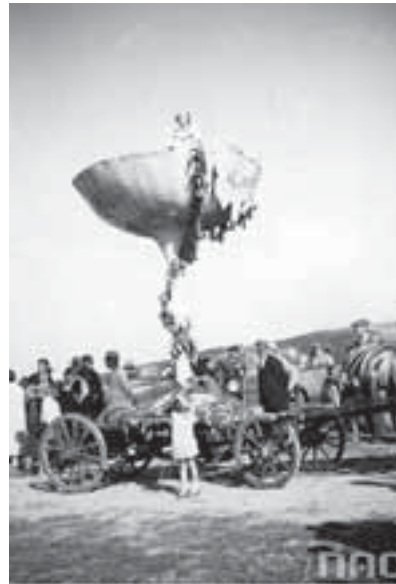
Свято збору винограду