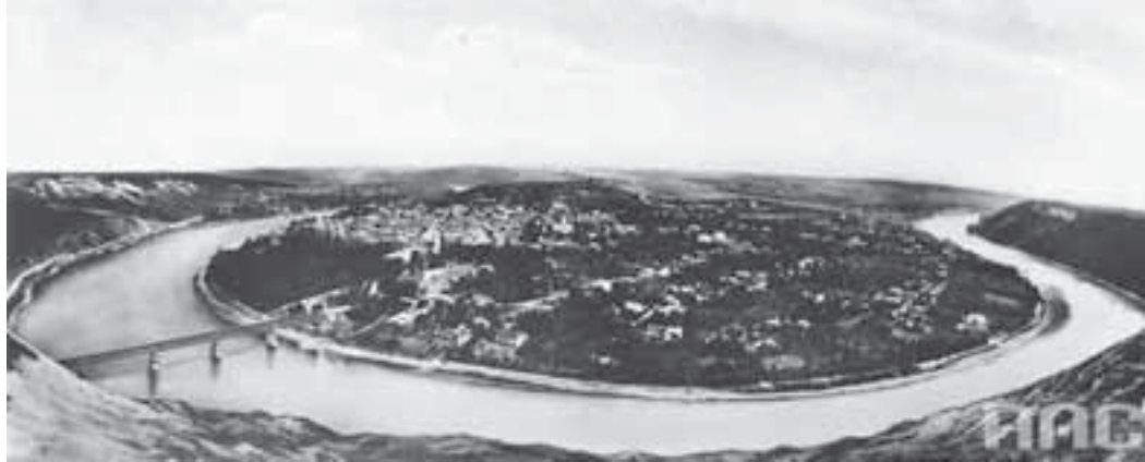
«Класичний» краєвид Заліщиків — із цієї гори місто й досі охоче фоткають туристи

«Заліщики є відмінним місцем для початку численних подорожей яристыми околицями Поділля, — написано у «Заліщики та околиця». — Далі мандрівки можна проводити автом, візком або сільським возом. Останній варіант проїзду є найдешевшим, хоча і найменш вигідним. Підводи найкраще замовляти у селі Добровляни. Ціна 10-14 злотих за день за драбинчастий віз для семи осіб. Щосуботи є цілоденні збірні виїзди автобусами до Кривча або Окопів Святої Трійці, які організовує заліщицький відділ Подільського туристично-краєз-