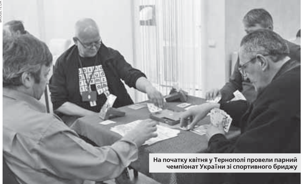
На початку квітня у Тернополі провели парний чемпіонат України зі спортивного бриджу