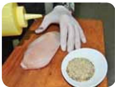
Натерти грудинку пряними травами і сіллю, залишити маринуватися на 4-5 хвилин