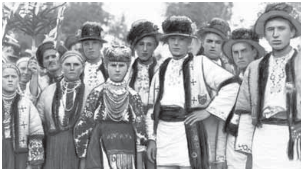
Жителі Заліщиків та околиць дефілювали для приїжджих у національних костюмах

Серед дальших подорожей популярними були, як і в наші дні, палац у Червоногороді, печера „Вертеба” у Більчі-Золотому, печера „Кришталева” у Кривчому, монастир і популярний тоді ярмарок в Улашківцях, замок у Ягільниці... Уже на початку 1930-х відпочивальників катали Дністром моторними човнами до Устечка, Горошової, Окопів, Раковця. Найбільша водна екскурсія сягала 99 км! Туристів зустрічали гостинно і, вочевидь, з них не дерли втридорога за помешкання, харчування і транспорт. Заліщики та околиця були одним із пріоритетів державної політики. Щоб популяризувати відпочинок у цих місцях, відпочивав у Заліщиках і керівник Польщі Юзеф Пілсудський. Згадок про те, що туди на відпочинок їздив президент України, прем'єр-міністр, голова Верховної Ради чи обласна адміністрація незалежної України, нам знайти не вдалося. Як не продають тепер масово і заліщицький виноград чи вина.