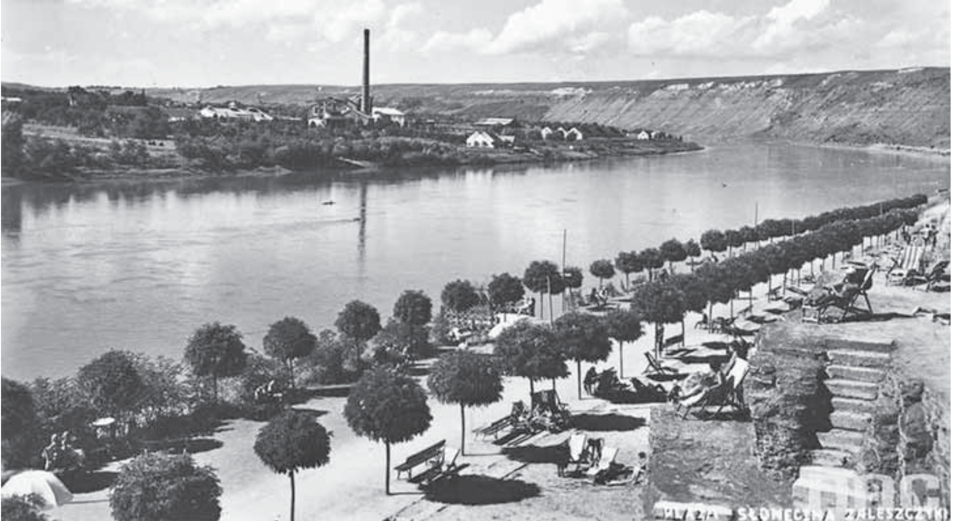
Панорама «Сонячного» пляжу у Заліщиках. Для туристів намагалися облаштувати якнайкращі умови, але водночас зберегти особливий дух «дикого» відпочинку