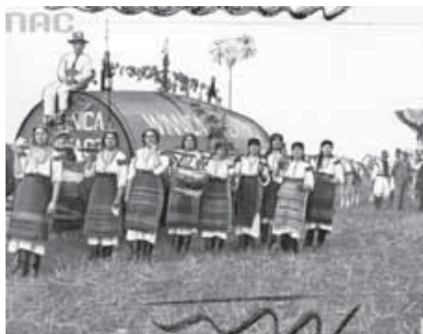
Врожай винограду перетворювали на веселе свято