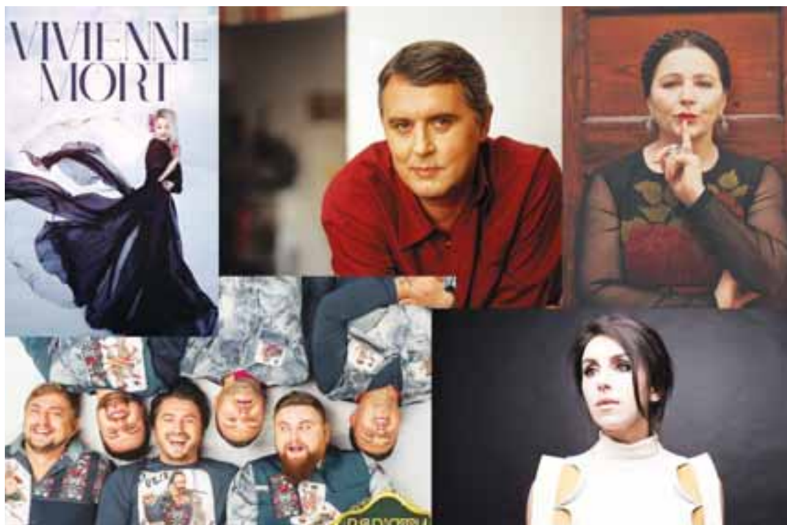
Травень пропонує тернополянам різноманітне дозвілля: від народного та джазового вокалу до шаленого гумору та епічної драматургії

Вперше до Тернополя завітає «єдиний живий класик української літератури», славнозвісний