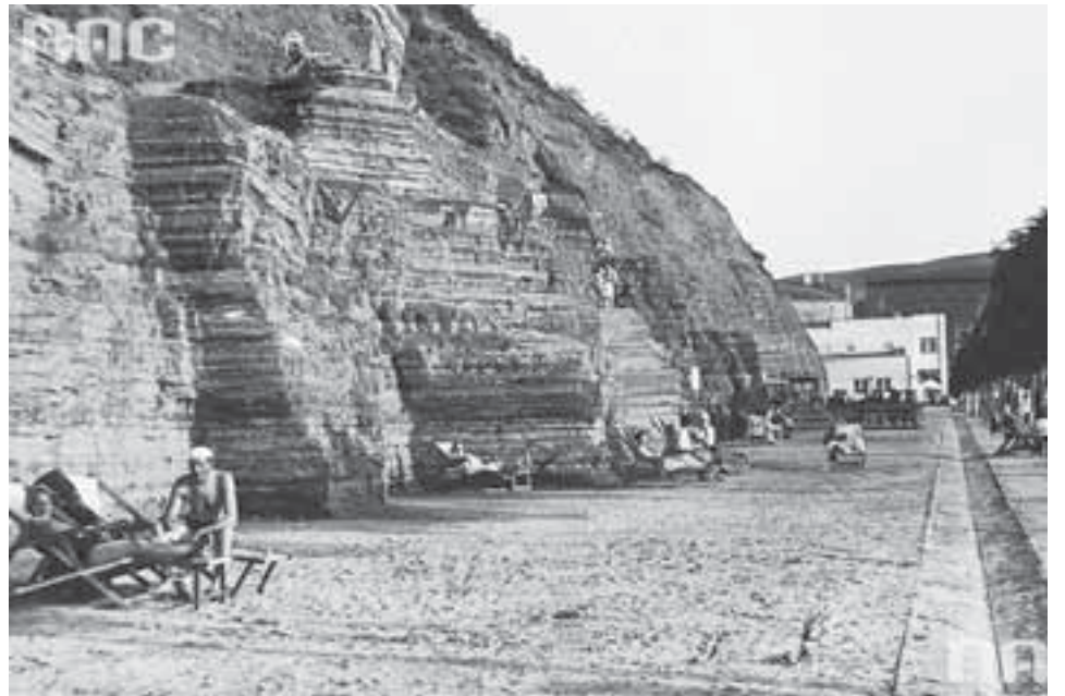
Затишні місця під скелями – камінь нагрівався і створював додатковий комфорт