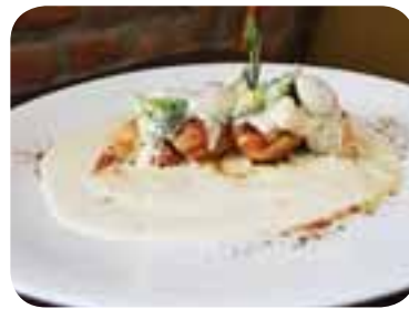
Нарізати готову грудинку шматками, полити соусом, викласти броколі і гриби