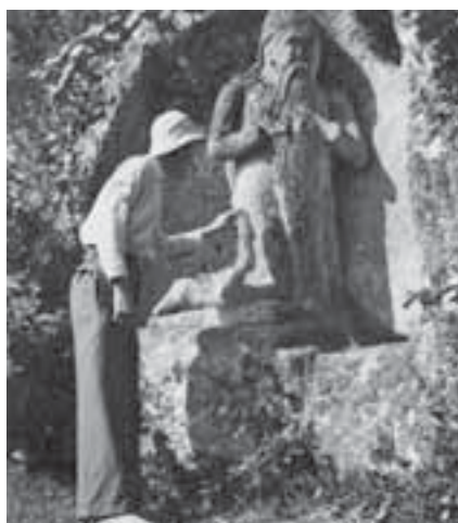
Фігура святого Онуфрія у скелях