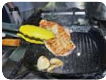
Обсмажити м'ясо на грилі до появи рум'яної скоринки, обсмажити печериці