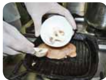
Викласти замариноване м'ясо на розжарену сковороду разом зі шматочками грибів