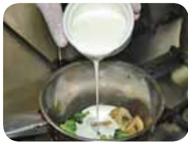
Підсмажити броколі, додати гриби, вершки і подрібнені сири, варити, помішуючи