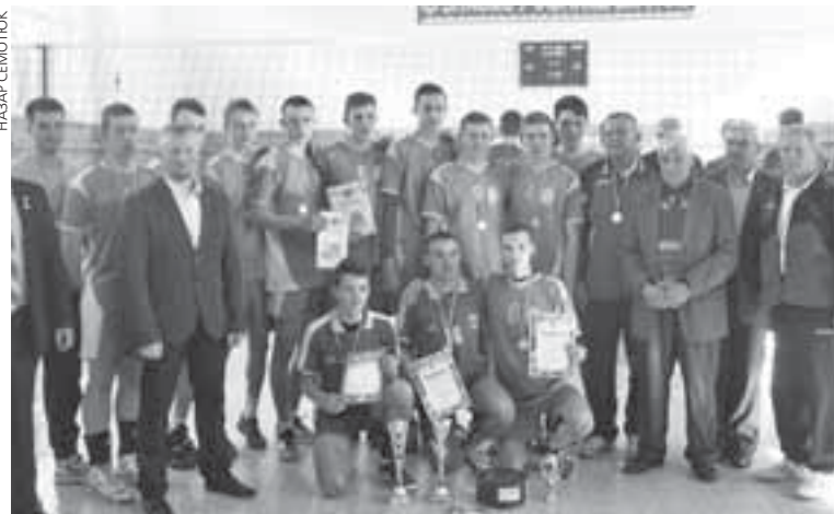
У фіналі «Дитячої ліги» команда з Теребовлі впевнено розібралася із харківським «Локомотивом» 3:0 і стала чемпіоном