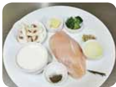
Підготувати необхідні продукти, зачистити куряче філе від плівок, зварити броколі