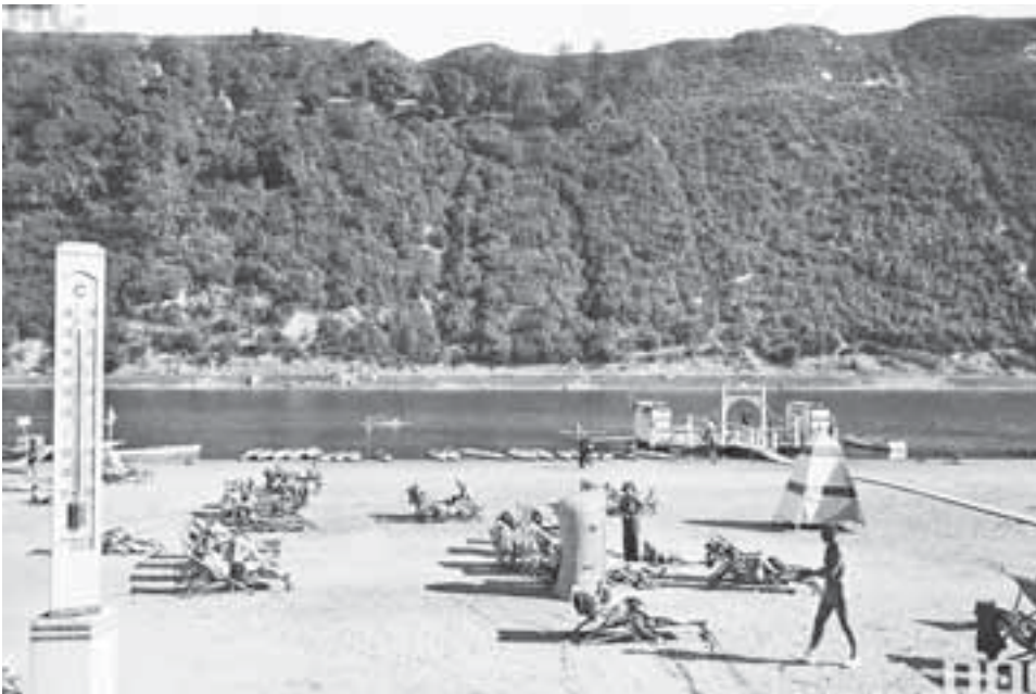
«Тінистий» пляж — за Дністром уже була Румунія, яка тоді займала Буковину

«Яр Дністра може слугувати для тих же засобів, що й узбережжя Середземного і Чорного морів. Тут можна успішно лікувати усі хвороби, що потребують сонячних і