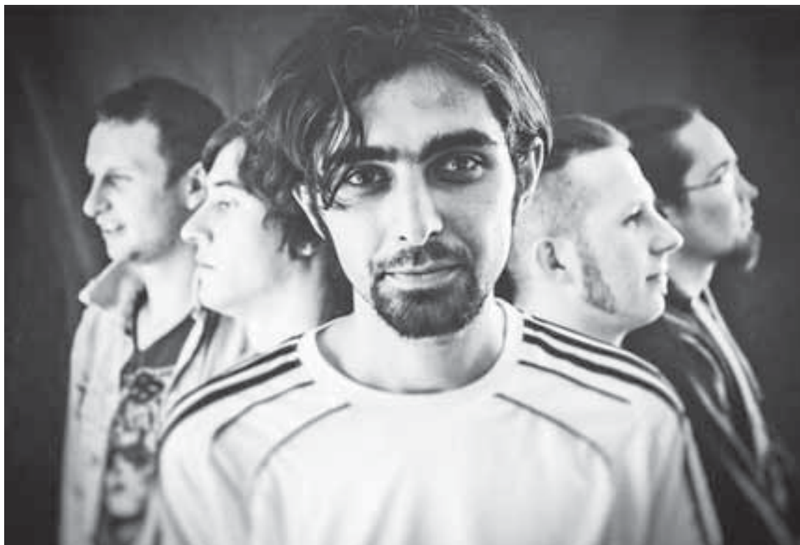
Рівненський гурт Man-Gust порвав публіку на співочому шоу «Х-фактор»

Reve ta Stohne працює в авторському стилі weedmask music. Цей гурт існує на межі свідомості