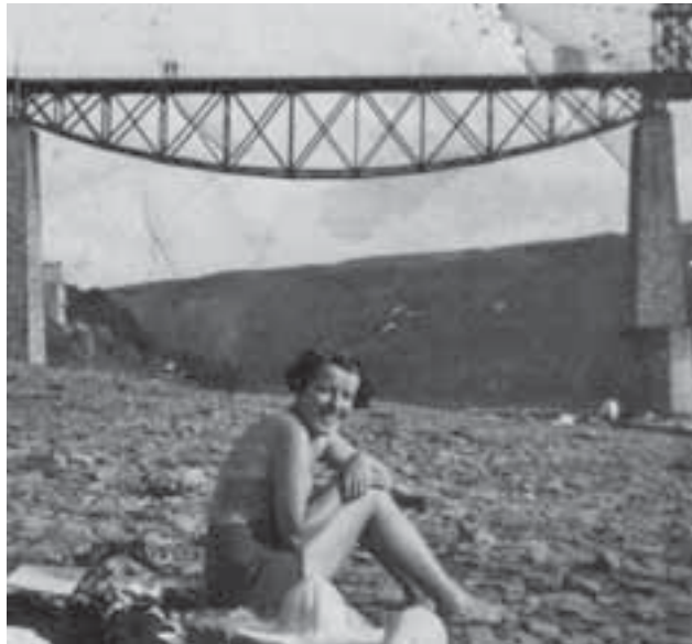
Окрім піщаних, був ще й кам'яний пляж