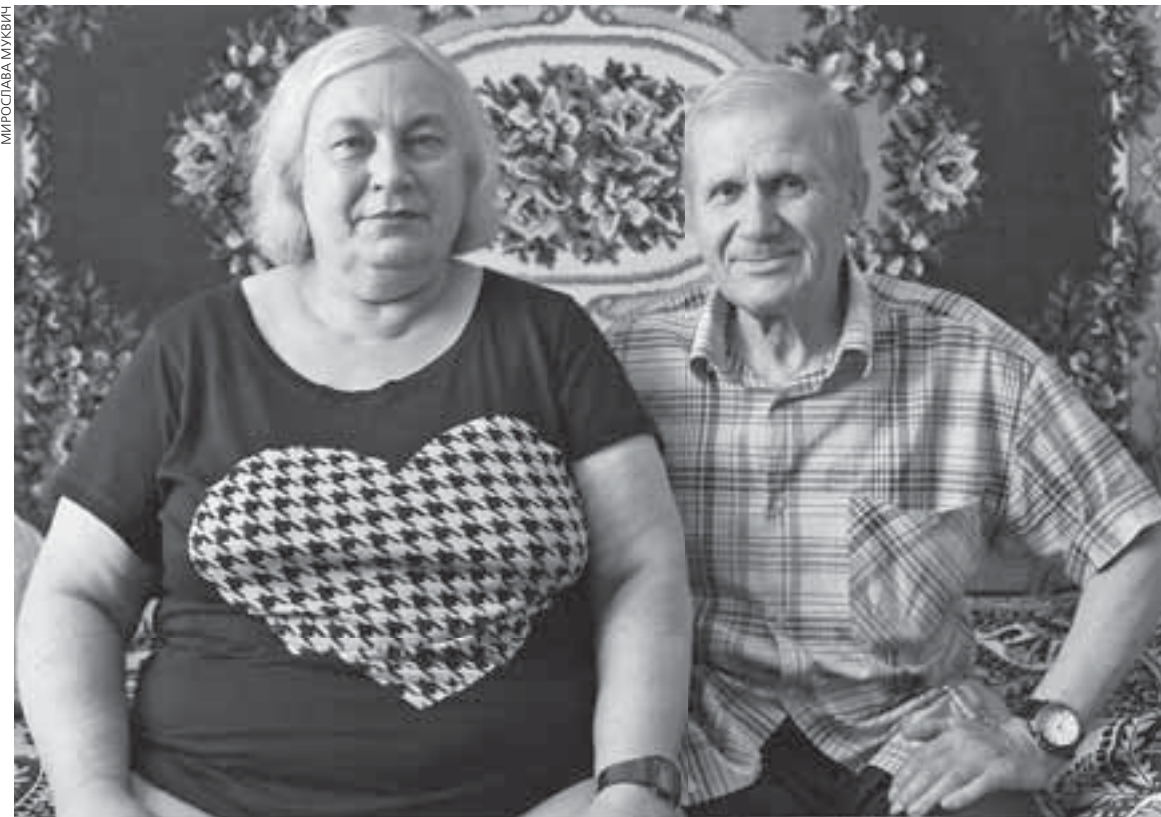
Подружжя Овсієнків живе разом 43 роки. Обоє кажуть, що секрет подружнього щастя — у вмінні поступатися одне одному

— Тут гарно лікують та годують. Ми не скаржимося. Тут є все, що нам потрібно. Часто займаємося у тренажерному залі.