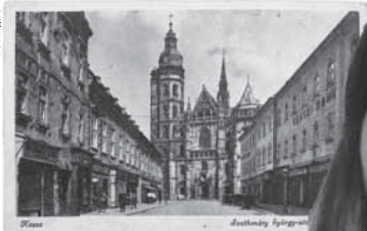
Костел Святої Альжбети, Кошице, 1938 р.

Франції. Мовляв, це все, що залишилося від тітки. А їй вони не потрібні і вона мені їх просто віддала. Також один француз цілком безкоштовно надіслав листівки 50-60-х років — це готична і романська архітектура.