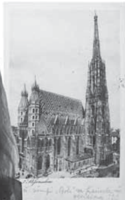
Собор Святого Стефана, 1936 р.

— Щороку їхня пошта видавала кардмаксимуми — це особливі листівки, коли марка, штамп і картинка перегукуються або зображення однакові, — продов-