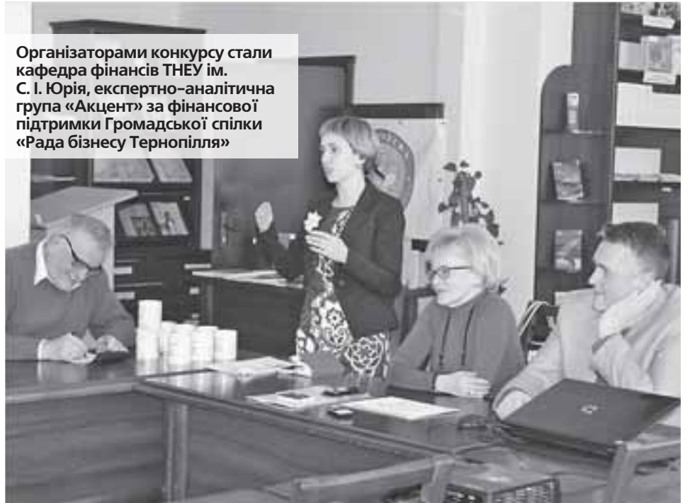
Організаторами конкурсу стали кафедра фінансів ТНЕУ ім. С. І. Юрія, експертно-аналітична група «Акцент» за фінансової підтримки Громадської спілки «Рада бізнесу Тернопілля»

Важливо ■ За дослідження адекватного використання коштів обласного бюджету Тернопільщини можна отримати фінансову винагороду. Також це хороший спосіб вдосконалитися в аналізі публічних грошей та діях влади