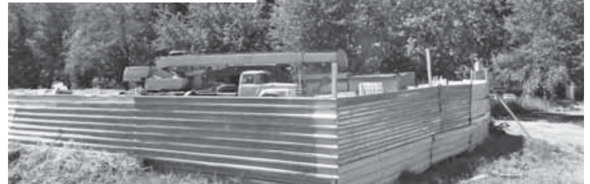
На вул. 15 Квітня вже розпочали будівництво кафе з мотелем та автосервісом. Тут можна побачити техніку та будматеріали