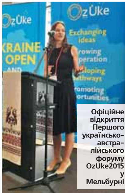
Офіційне відкриття Першого українсько-австралійського форуму OzUke2015 у Мельбурні