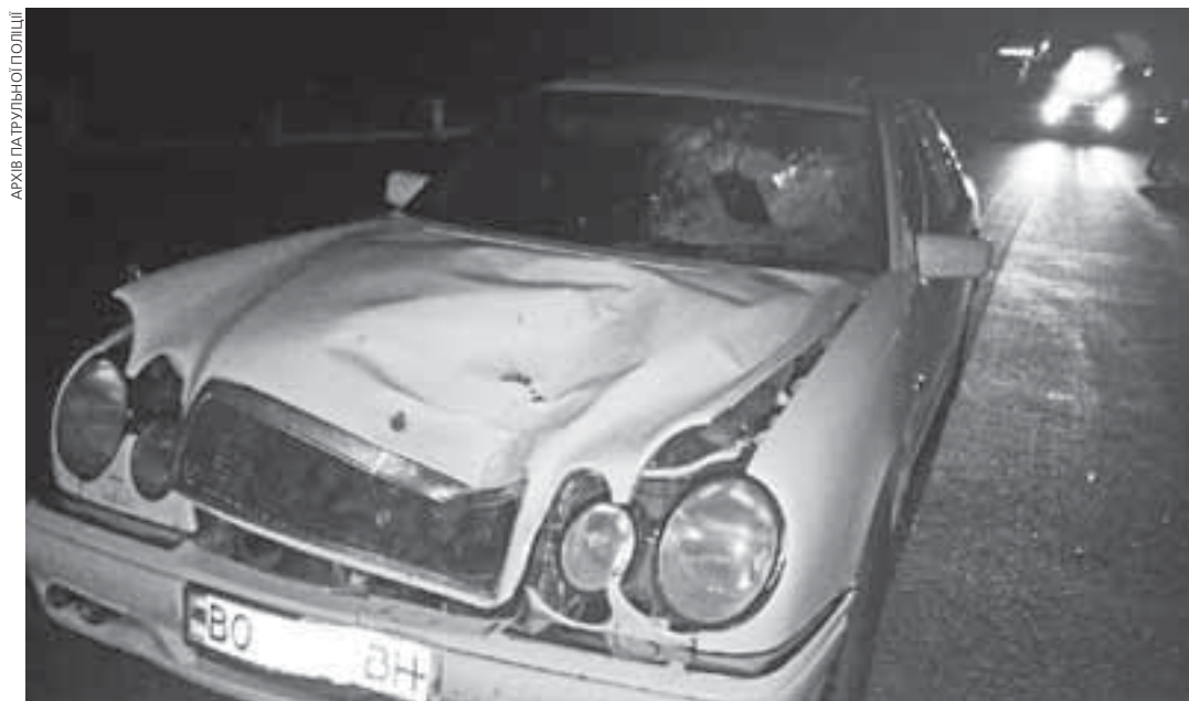
Аварія трапилась уночі з 2-го на 3-тє липня при в'їзді у Тернопіль. Пішохід переходив дорогу у недозволеному місці. Водій був у стані наркотичного сп'яніння