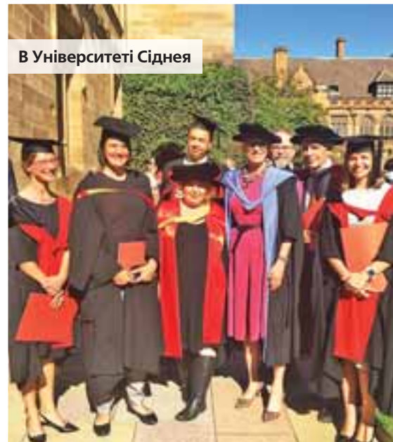
В Університеті Сіднея