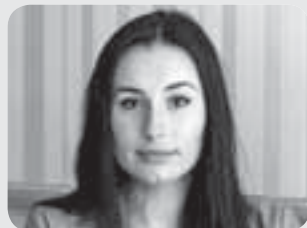
Христина Глаз — Медіа Корпорація RIA