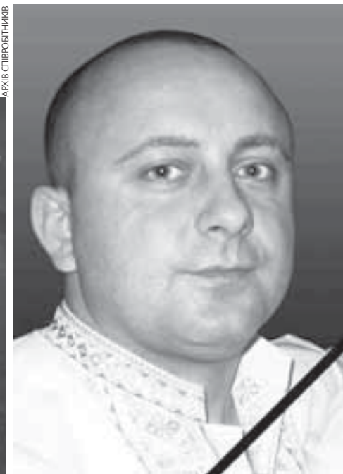
Юрію, який загинув під колесами автівки, було лише 33 роки. Співчуваємо його рідним та близьким!

воохоронці не мали підстав узяти чоловіка під варту, — повідомляють у секторі комунікації Головного управління Національної поліції в Тернопільській області. — Аварія трапилась за межами пішохідного переходу, в темну пору доби на погано освітленій ділянці дороги. Стан наркотичного сп'яніння у цьому випадку не є причиною наїзду, а обтяжливою обставиною. Хоча остаточно говорити про причини ще рано. Водій зараз перебуває на лікуванні. Слідство триває, відбувається низка експертиз.