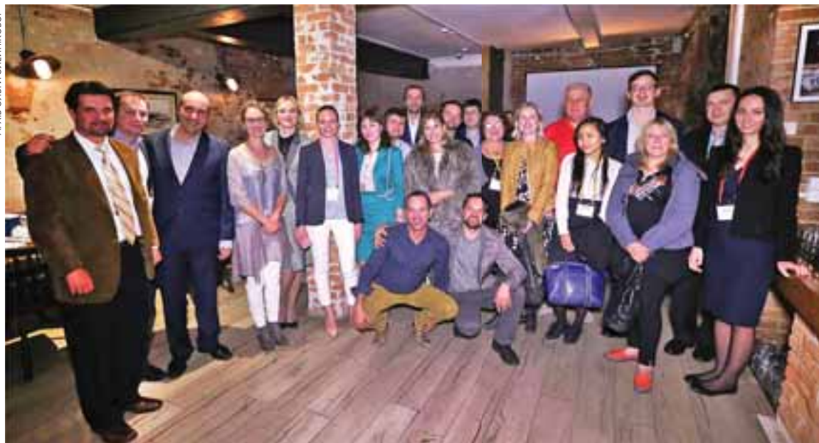
Українська діаспора в австралійському Мельбурні

— Культурне життя українців в Австралії є надзвичайно активним, переважно в Мельбурні та Сіднеї. Окрім регулярних церковних заходів та заходів в українських суботніх школах, жвавим є громадське та академічне життя. Українські активісти виступають з акціями протесту, регулярно фінансово підтримують воїнів АТО та мають надзвичайні успіхи у лобюванні інтересів української держави в Австралії на політично-