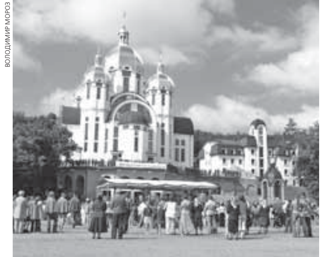
Проща у Зарваниці щороку збирає сотні тисяч паломників зі всієї України та із за кордону

Релігія ■ До участі у пішій прощі до Зарваниці УГКЦ запрошує тернополян 16-17 липня 2016 року. У дорозі паломників обіцяють годувати, а важкі речі будуть везти автобусами. Проща присвячена «Року Божого Милосердя» та молитвам за мир в Україні