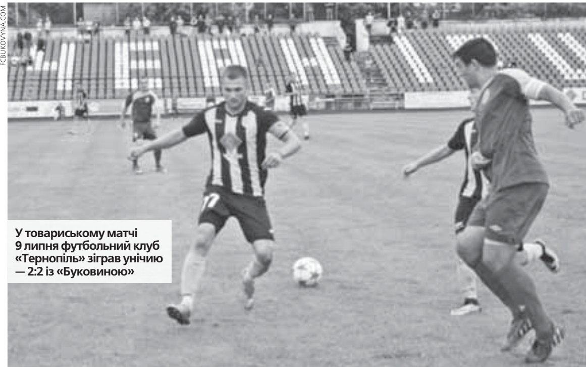
У товариському матчі 9 липня футбольний клуб «Тернопіль» зіграв унічию — 2:2 із «Буковиною»