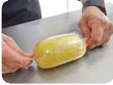
Зварити крупу, охолодити, викласти на харчову плівку і згорнути цукеркою