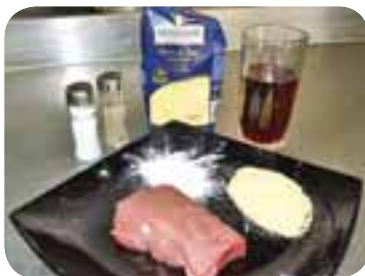
Зачистити від плів телячу вирізку, підготувати решту необхідних продуктів

Підготовлене м'ясо і поленту чоловік виклав на тарілку гіркою, полив винним соусом і прикрасив страву зеленню. А тоді запропонував мені скуштувати. Сказати, що смаколик припав мені до смаку, означає нічого не сказати. Бо він був неймовірно смачним!