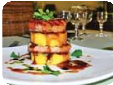
Полити готову страву соусом, приготовленим на основі червоного десертного вина