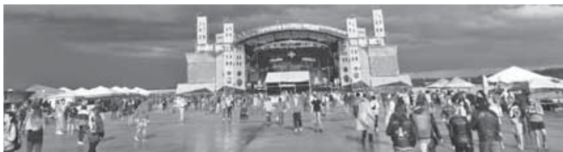
На фестивалі «Файне місто» було близько 14 тисяч відвідувачів з усієї України