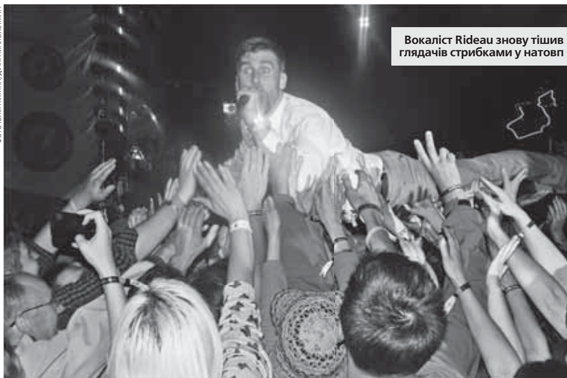
Вокаліст Rideau знову тишив глядачів стрибками у натовп

Дрес-код на фестивалі особливий — що дивакуватіше, то краще. Кого тут тільки не зустрінеш: єдинокорі, панки, індіанці, готи, феї, зомбі, словом, вільні люди. Звичайним котикам і тигрикам