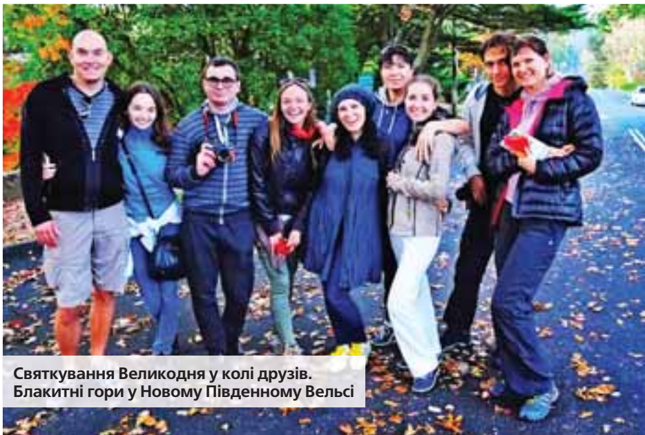
Святкування Великодня у колі друзів. Блакитні гори у Новому Південному Вельсі