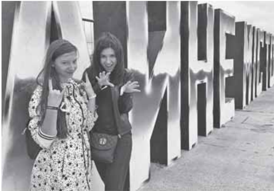
Біля величезного напису «Файне місто» фотографувалися всі охочі