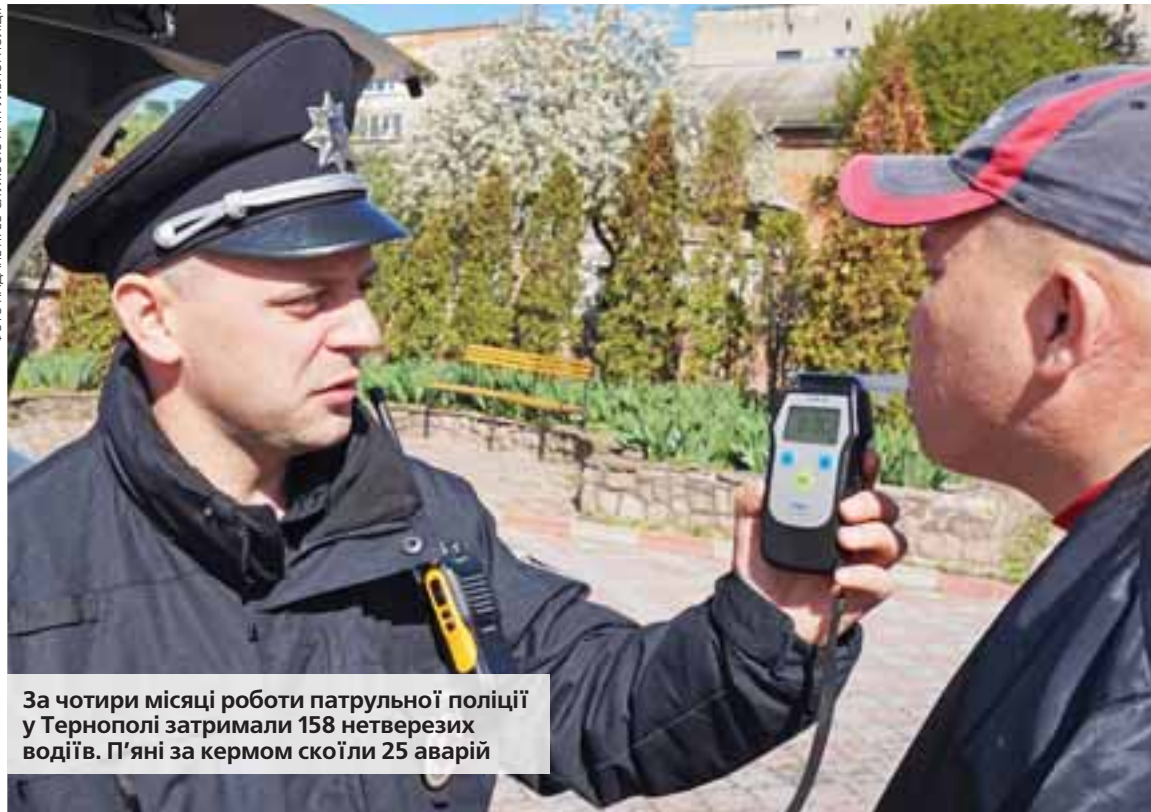
За чотири місяці роботи патрульної поліції у Тернополі затримали 158 нетверезих водіїв. П'яні за кермом скоїли 25 аварій

За водіння у нетверезому стані перший штраф тепер складе 10200 грн плюс позбавлення права керування на рік. Удруге штраф за таке правопорушення вже ста-