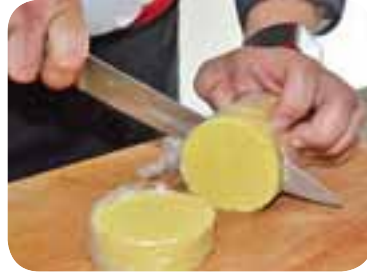
Добре втрамбувати кукурудзяну кашу, розрізати її на декілька частин