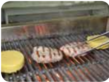
Відрізати від шматка м'яса два стейки, обсмажити на грилі разом із полентою