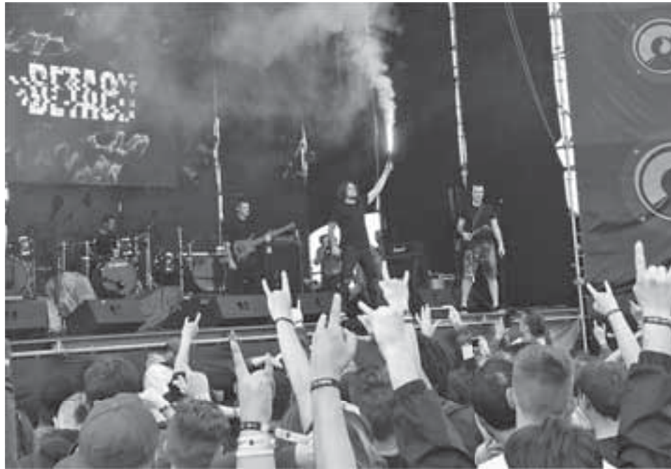
Кияни Detach палили фаєри під час свого виступу