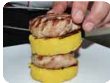
Викласти підготовлені стейки і поленту на тарілку гіркою, чергуючи м'ясо і кашу