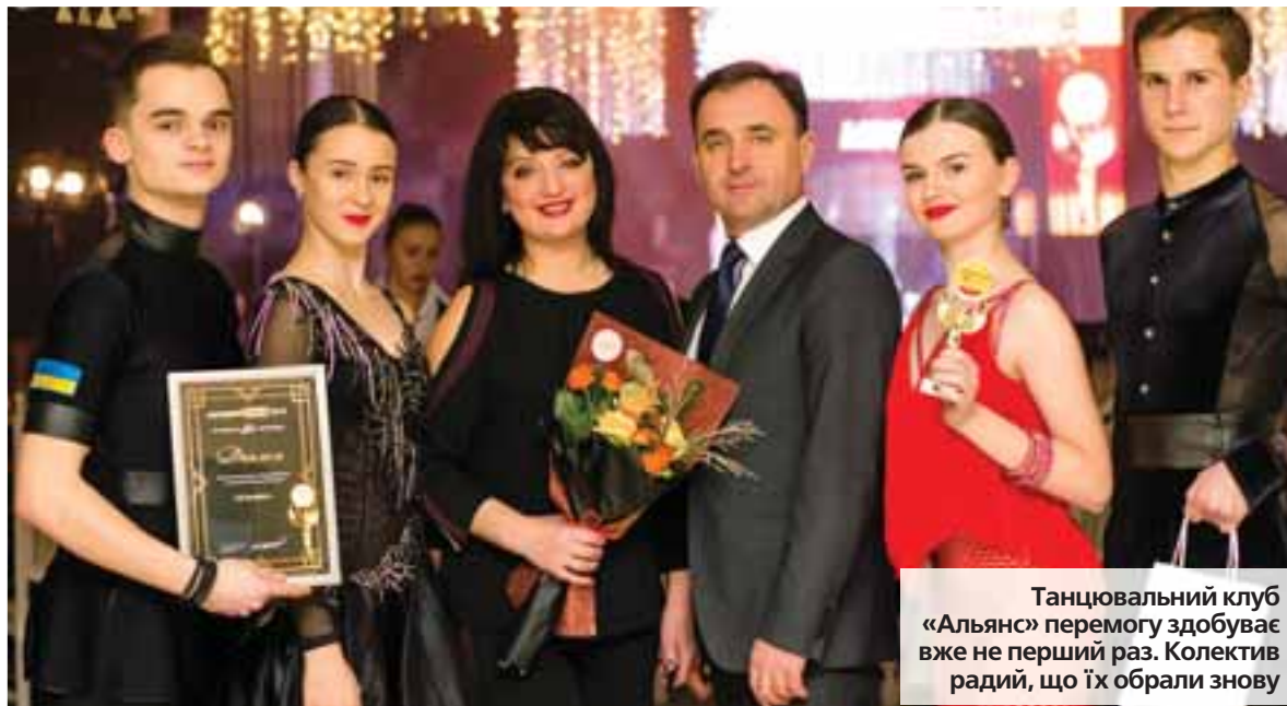
Танцювальний клуб «Альянс» перемогу здобуває вже не перший раз. Колектив радий, що їх обрали знову

Визнання ■ Отримання нагород за участь у конкурсі «Народний бренд» стало доброю традицією для тернопільських підприємств, кажуть їх представники