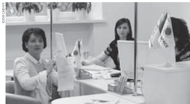
Центр Open Space у Тернополі урочисто відкрила перший заступник Міністра юстиції України Олена Сукманова (ліворуч)

Серед 14-ти реєстраційних послуг, які надають в Open Space: державна реєстрація народження, смерті. Видача свідоцтва про народження, про шлюб, про розірвання шлюбу, про зміну імені, смерть.