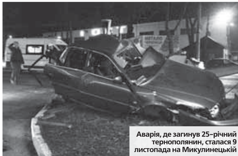
Аварія, де загинув 25-річний тернополянин, сталася 9 листопада на Микулинецькій

Перед с. Плебанівка водій «Шевроле» не впоралася з керуванням, і авто з'їхало з траси, де зіткнулося з деревом. І водійку, і ще двох пасажирів швидко доправили до лікарні. Вночі 17-річна дівчина, двоюрідна сестра кермувальниці, від отриманих травм померла. Серйозно травмована і сама водійка, яка отримала сильний удар. Травми отримав і власник авто. Однак, він постраждав найменше.