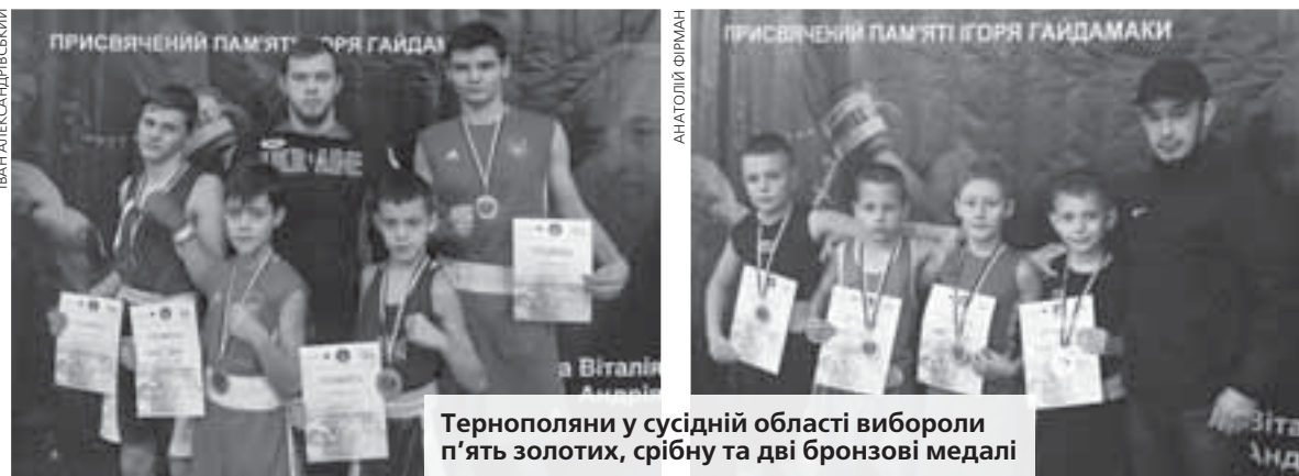
Тернополяни у сусідній області вибороли п'ять золотих, срібну та дві бронзові медалі