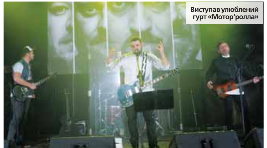
Виступав улюблений гурт «Мотор'ролла»

— Перемогу отримуємо вже другий рік поспіль, це — показник того, що компанія динамічно розвивається та дарує тернополянам радість. Мало хто знає, що ми не лише продаємо, а й самі вирощуємо квіти. «Флорія» має власну службу доставки, тож кожен охочий може замовити сюрприз для своїх рідних чи близьких, і наші працівники із задоволенням виконають бажання клієнтів. До речі, немає жодної, навіть найбільш екзотичної квітки, яку ми не могли б знайти. Навіть, якщо її немає нині в салоні, ми зробимо все для того, аби вона найближчим часом там з'явилася. Адже незмінне гасло для нас: «Свято — це коли є квіти».