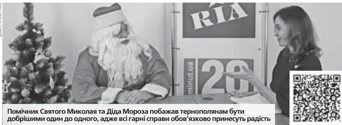
Помічник Святого Миколая та Діда Мороза побажав тернополянам бути добрішими один до одного, адже всі гарні справи обов'язково принесуть радість

Діда Мороза та Святого Миколая спонукав уже мій син. Коли йому було 4, і він побачив, що я вдяга-