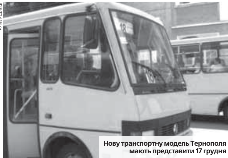
Нову транспортну модель Тернополя мають представити 17 грудня

Студентів розділили на три групи від 15 до 25 чоловік з кураторами. Кожна група паралельно проводила три дослідження: комплексне обстеження пасажиропотоків, обстеження інтенсивності транспортних потоків та опитування домогосподарств. Група, в якій був хлопець, досліджувала пасажиропотік. Представники компанії видали спеціальні бланки, які студенти мали заповнити. Для дослідження пасажиропотоку, зокрема, студент з яким спілкувалася журналістка, мав їхати у маршрутці і рахувати, скільки людей зайшло і яким способом вони розраховувалися за проїзд. Таке дослідження студент мав зробити кілька разів на день на двох маршрутах — № 9 та 7. Роботу студентів контролювали представники компанії. Просили, щоб ті надсилали свої геолокації, щоб довести, що справді їздять у маршрутках, а не придумують цифри. Було 27 локацій, на яких стояли студенти і перевіряли, скіль-