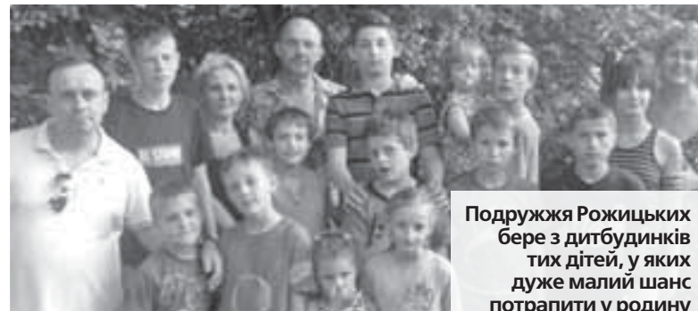
Подружжя Рожицьких бере з дитбудинків тих дітей, у яких дуже малий шанс потрапити у родину

10 років тому жінка зовсім випадково почула історію хлопчика