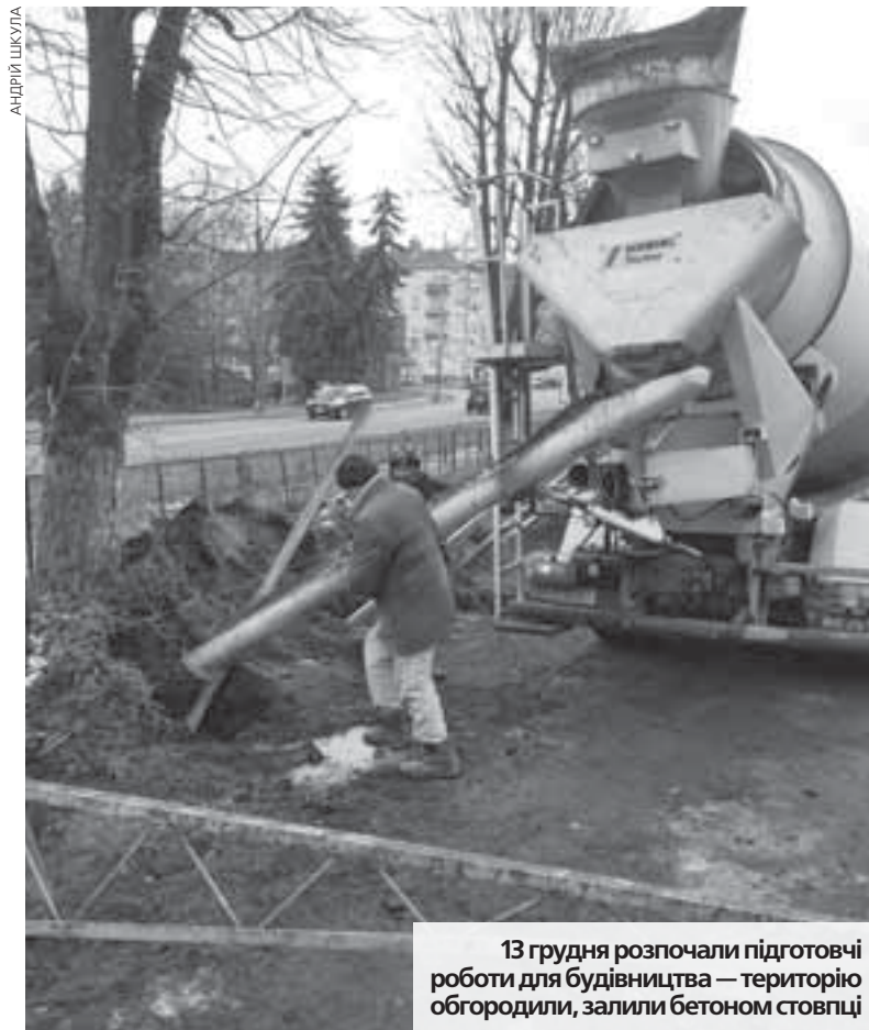
13 грудня розпочали підготовчі роботи для будівництва — територію обгородили, залили бетоном стовпці