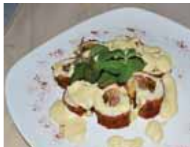
Готову страву полити вершково-сирним соусом, прикрасити зеленню