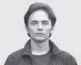
Павло ЛОТОЦЬКИЙ, фотограф:

— Ця тьотя пече різні смачні солодкі торти і печиво. То така професія є, називається кондитер. Мені мама розказувала. Я, як виросту, теж стану такою тьотеною.