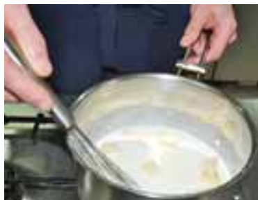
Змішати вершки з сиром, довести до кипіння, варити, поки не розтопиться сир