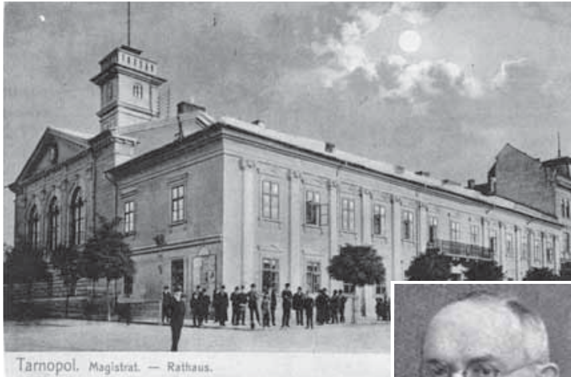
Tarnopol. Magistrat. — Rathaus. Тернопільський магістрат — один із центрів політичної сили польської влади до війни

Подібні труднощі виникали, як виглядає, з допущення влади, котра контролювала і виборчі списки, і комісії. А в тому, що були такі