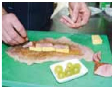
Відбити м'ясо, посипати спеціями, нарізати товстою соломкою шинку і сир