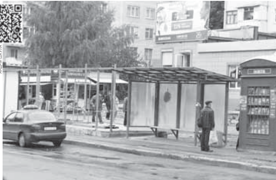
Міськрада сформувала список із понад 60 міських зупинок, де проведуть реконструкцію, яка передбачає будівництво магазину

А ось щодо того, що часто-густо замість великих і зручних зупинок, наприклад, на вул. Лучаківського біля церкви Св. Йосафата, з'являється магазин із невеличким навісом, який продає з трьох боків та максимум 4-5 чоловік сховається від дощу. Тому тут виникає питання: чи потрібна була ця заміна?