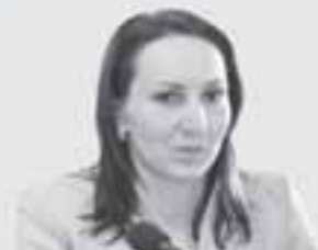
Олена ПІДГРУШНА, спортсменка:

На прохання читачів ми відновлюємо рубрику «Відомі люди очима дітей». Задля експерименту наш кореспондент показала дітям фото політиків, високопосадовців і просто відомих тернополян. І запитала: «Хто ці люди?»