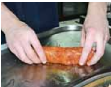
Панірувати рулет у борошні, яйці та суміші чорного перцю і паприки, запекти