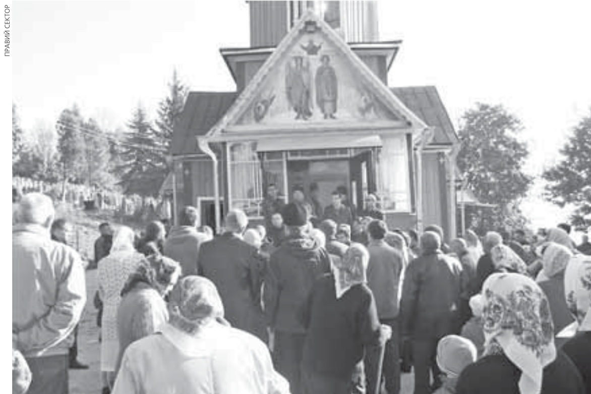
Члени громади, яка вирішила вийти з підпорядкування Московському патріархату, готувалися до цього півроку. Як кажуть, робили все ретельно, аби потім хтось не відсуджував їхній храм

— Як з'ясувалося, вони ще до переходу приватизували на священника Московського патріархату церковний будинок, — додає отець Швець.