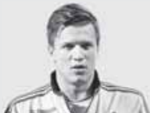
Євген КОНОТПЛЯНКА, футболіст:

— Ця тьотя грає у театрі. Вона — актриса і має багато костюмів. І ще має таку смішну велику різнокольорову маску, в якій вона виходить на сцену.