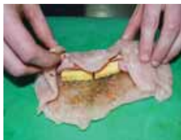
Викласти шинку, виноград і сир на філе, згорнути м'ясо з начинкою рулетом