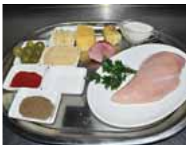
Помити виноград і зелень, зачистити філе, підготувати решту продуктів