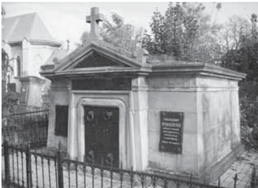
Могила Володимира Лучаківського розташована неподалік брами на Микулинецькому кладовищі у Тернополі