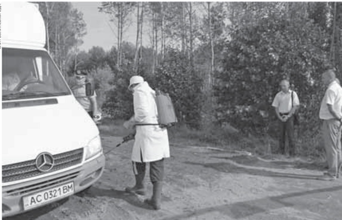
На пропускних пунктах дезінфікують колеса автомобілів, що виїжджають із території, на якій оголосили карантин

вали у першому випадку перевести роботу господарств на закритий режим роботи, у другому — обробляти тварин спецзасобами.