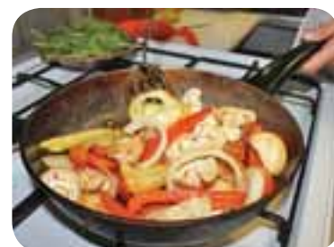
Викласти до напівготових овочів тушковану свинину, ковбаски і картоплю