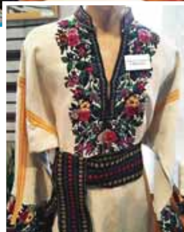
Чоловічі сорочки вирізняються яскравими кольорами

У борщівській вишиванці домінує чорний колір. І не даремно. Адаже, за легендою, у XVI-XII століттях турки напали на кілька сіл Борщівського району та повбивали всіх чоловіків. Жінки, оплакуючи свою гірку долю, присягнули упродовж семи по-