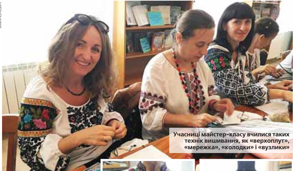
Учасниці майстер-класу вчилися таких технік вишивання, як «верхоплут», «мережка», «колодки» і «вузлики»