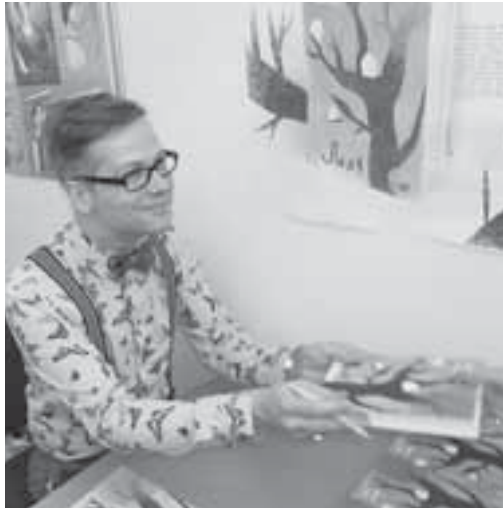
Польський письменник Яцек Денель підписує український переклад книги-спогадів своєї бабусі «Ляля»