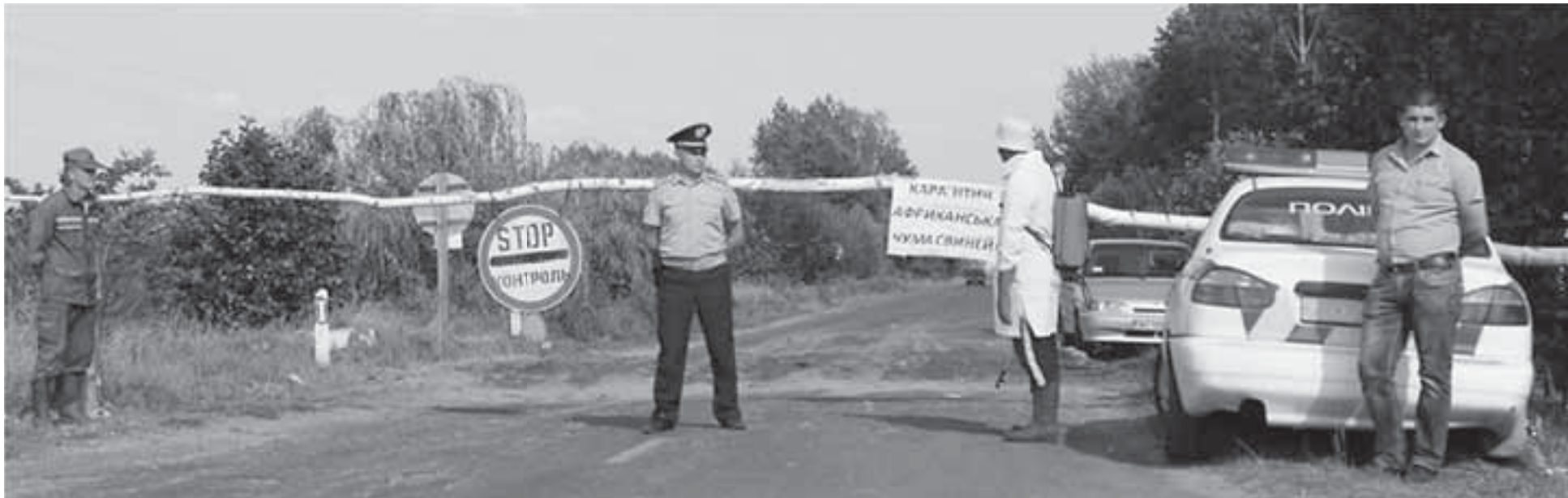
Встановити контрольні-пропускні пункти, які слугують дезінфекційним бар'єром, як-от на Волині, Тернопільщині поки не можна. Мовляв, немає юридичного підґрунтя