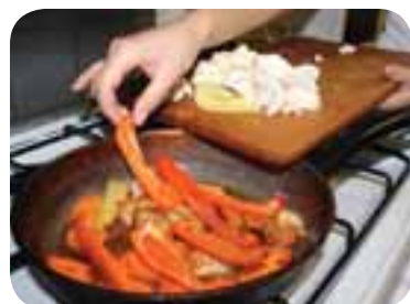
Коли овочі зм'якнуть, додати нарізані гриби, перець цвітну капусту і кабачок