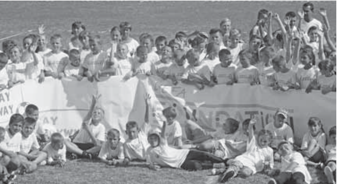
Дві сотні дітей із Підгаєччини упродовж кількох днів знайомилися з тонкощами гри у футбол

Під час фестивалю діти також взяли участь у цікавих конкурсах та естафетах. Найактивніші отримали