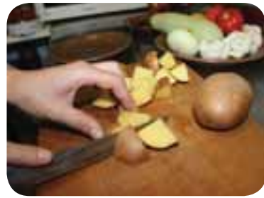
Нарізати картоплю, обсмажити у фритюрі, кубики курячого м'яса — у сковороді