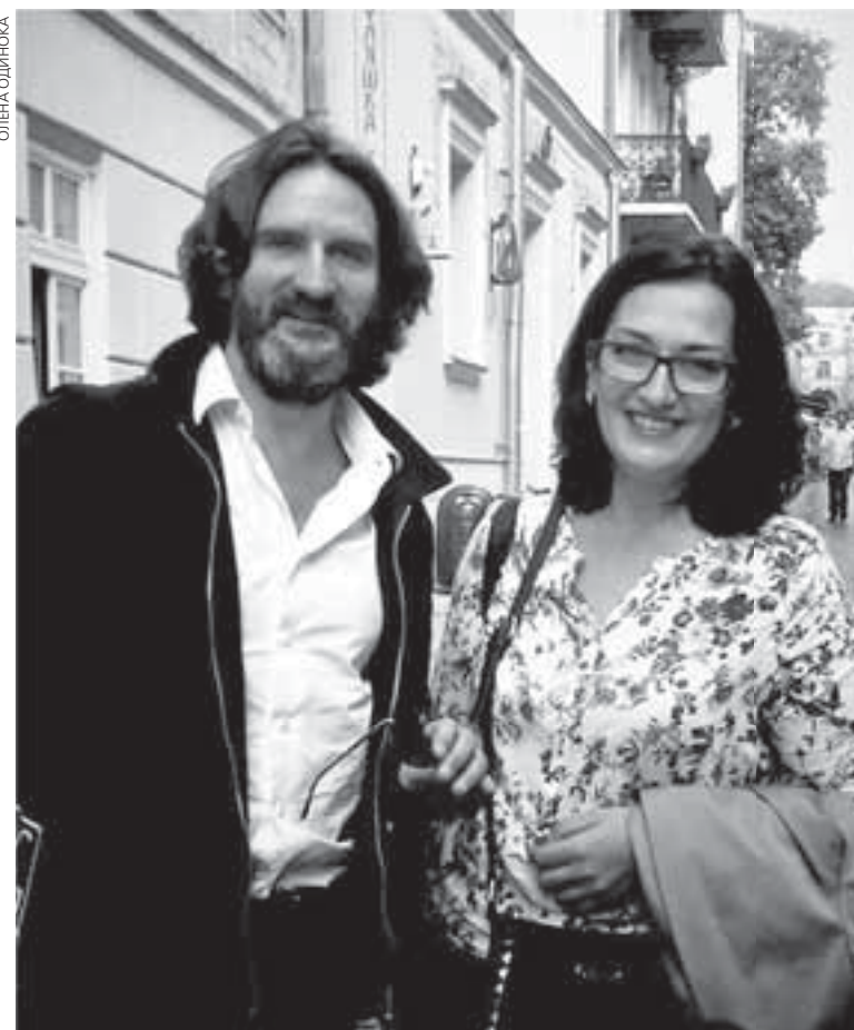
Чи не найочікуванішим гостем цьогорічного Форуму у Львові став Фредерік Бегбедер, якого запросило видавництво «Країна мрій»

— Я на Форумі вже, певно, дванадцятий раз, — розповідає чернівецьчанин Андрій. — Перші рази приїздив ще студентом, тоді ми просто ходили наосліп — на що втрапимо, те й добре. Останні роки я вже так не роблю.