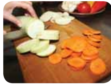
Накраяти кабачок, цибулю і моркву кружальцями, викласти до смаженого м'яса