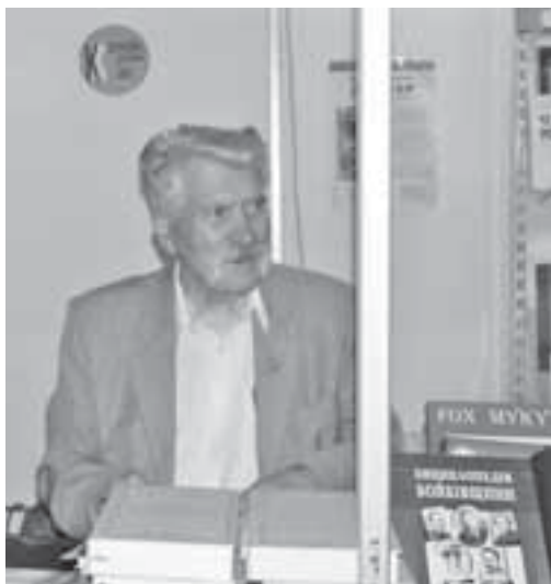
Один із гостей цьогорічного Форуму видавців — Левко Лук'яненко