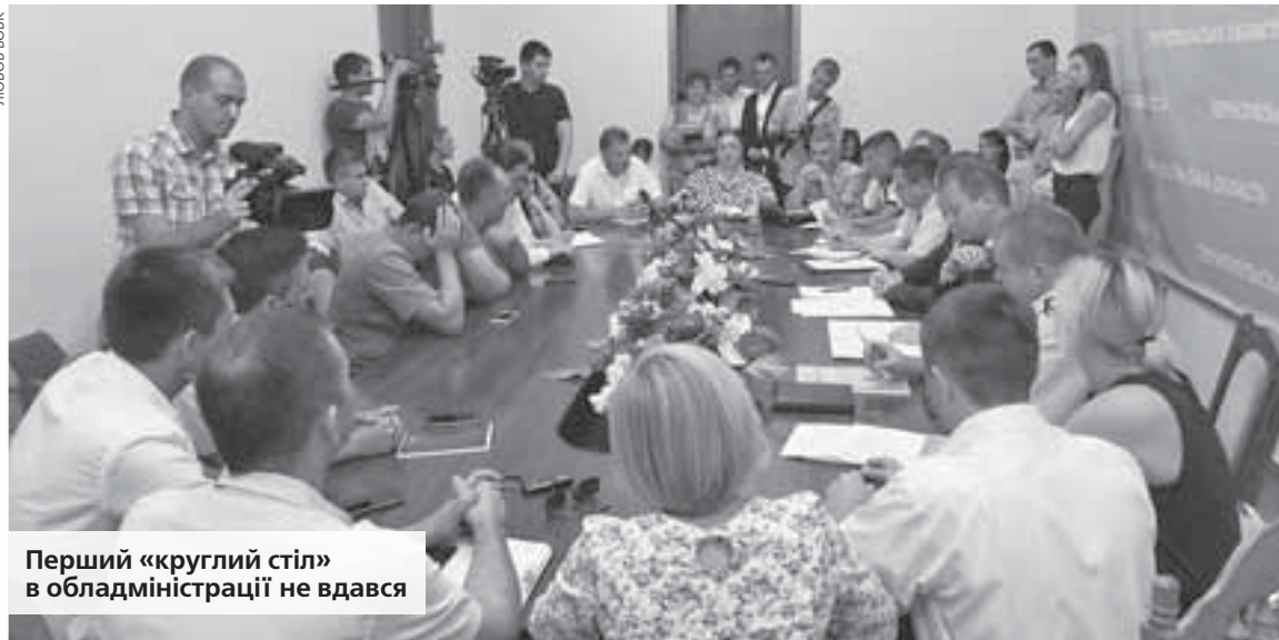
Перший «круглий стіл» в обласній адміністрації не вдался

Учасники «круглого столу» і присутні громадяни таки зачекали півгодини на очільника області. Найбільше питань мали