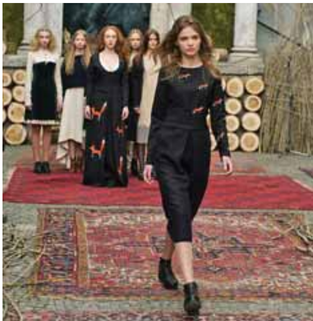
Візиткою одягу від Катерини Тимочко є зображення лисички