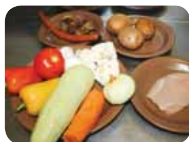
Зачистити курятину, помити і почистити овочі, протушкувати свинячу шию

СКІЛЬКИ ЧОГО ТРЕБА: 200 г свинячої шиї, 180 г кабачка, 150 г картоплі, 150 г курячого філе, 105 г помідора, 95 г шампінйонів, 75 г болгарського перцю, 50 г ріпчастої цибулі, 60 г мисливських ковбасок, 45 г моркви, 25 г лимона, по щіпці приправи до грилю і грибною, 100 мл олії, сіль до смаку.