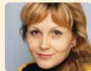
салат оцтом, вимішати, ще поварити 5-10 хв.

перекласти до кабачків. Нарізати шматками помідори і перець, додати до кабачків, влити олію, заправити цукром, спеціями вимішати. Поставити на середній вогонь, довести до кипіння і варити, помішуючи, 40 хв. після закипання. Заправити