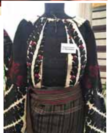
Борщівська весільна сорочка, яка мала значення оберегу

колінь носити сорочки, вишиті чорними нитками. Їх одягали і на весілля, і у свята. Сьоме покоління завершило своє земне життя у 1920-х роках минулого