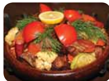
Довести страву до готовності у духовці впродовж 5 хвилин, готову — прикрасити