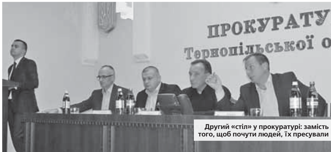
Другий «стіл» у прокуратурі: замість того, щоб почути людей, їх пресували

до новопризначеного прокурора Тернопілля.